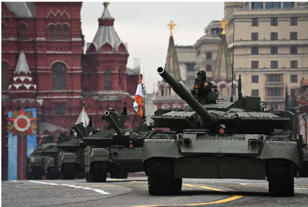
Hlavní bitevní tanky T-72B3M od 1. gardového tankového pluku na Rudém náměstí

Výcvik základního člena americké posádky M1 Abrams trvá 22 týdnů. Tento výcvik jen dává vojákovi velmi základní sadu dovedností, aby byl funkční. Skutečné operační odbornosti lze dosáhnout pouze během měsíců, ne-li let, dodatečného výcviku nejen v samotném systému, ale také jeho zaměstnáváním jako součást podobně vyškoleného týmu kombinačních zbraní. Jednoduše řečeno, ani ukrajinská tanková posádka, která má zkušenosti s provozem tanků T-72 nebo T-64 ze sovětské éry, nebude schopna okamžitě přejít na hlavní bojový tank západního typu.