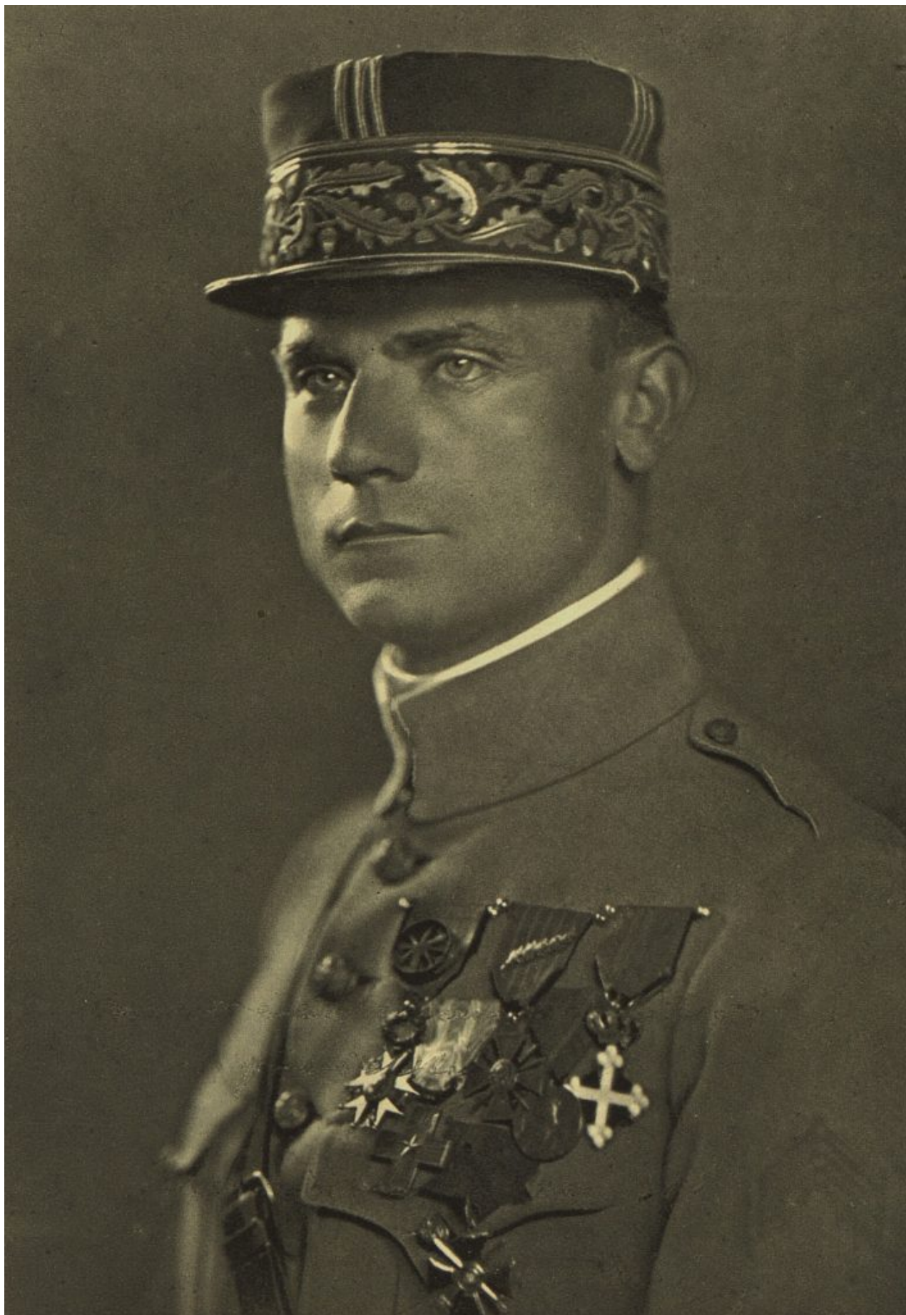
M. R. Štefánik v uniformě francouzského generála. Fixace ČSR na Francii byla značná