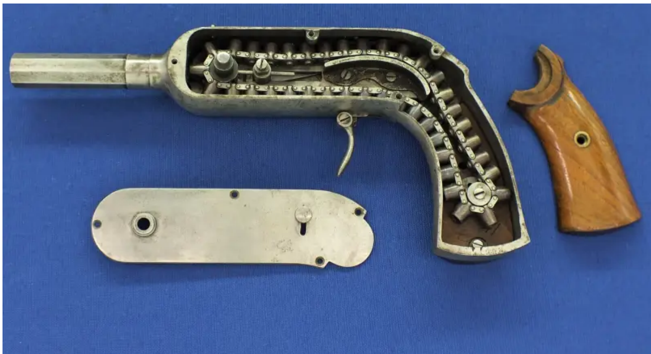
Stejná pistole s odstraněným krytem těla.