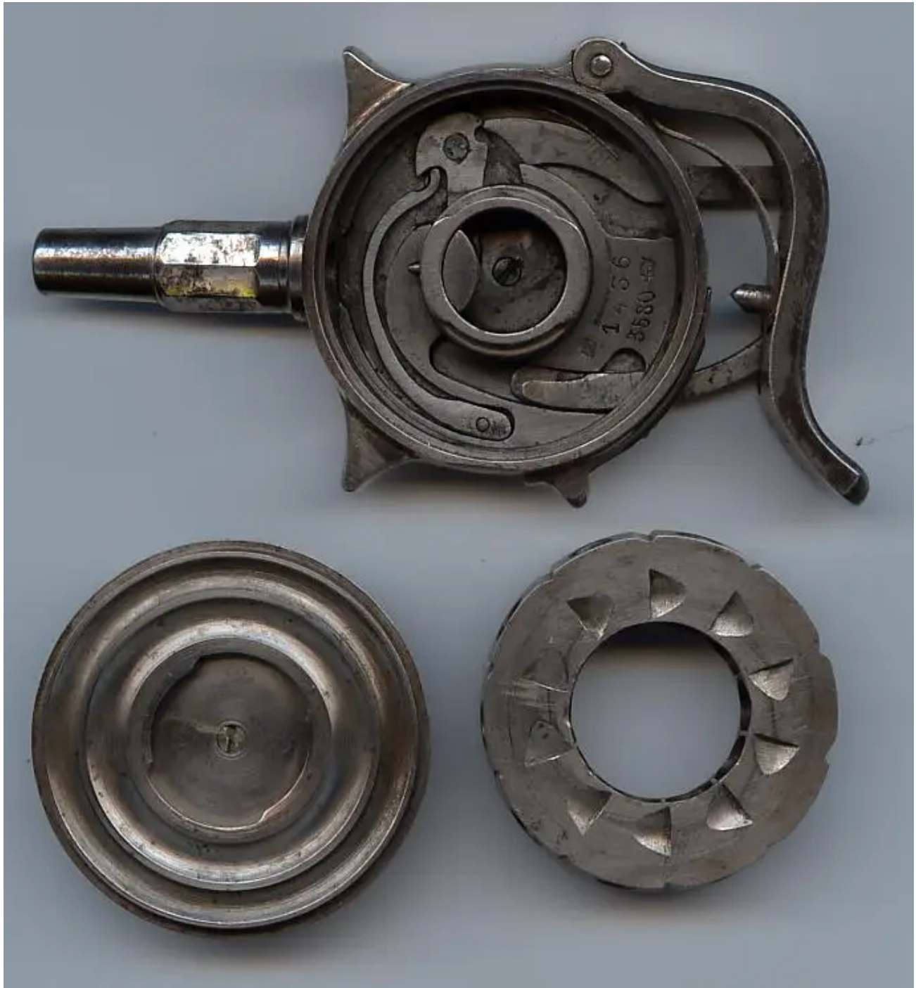
"Obránce" zevnitř. Nedaleko je kryt pouzdra a zásobník disku.