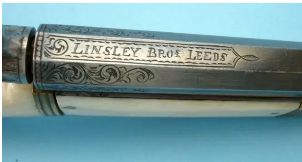
A toto je jeho označení, vyryté na hlavni.