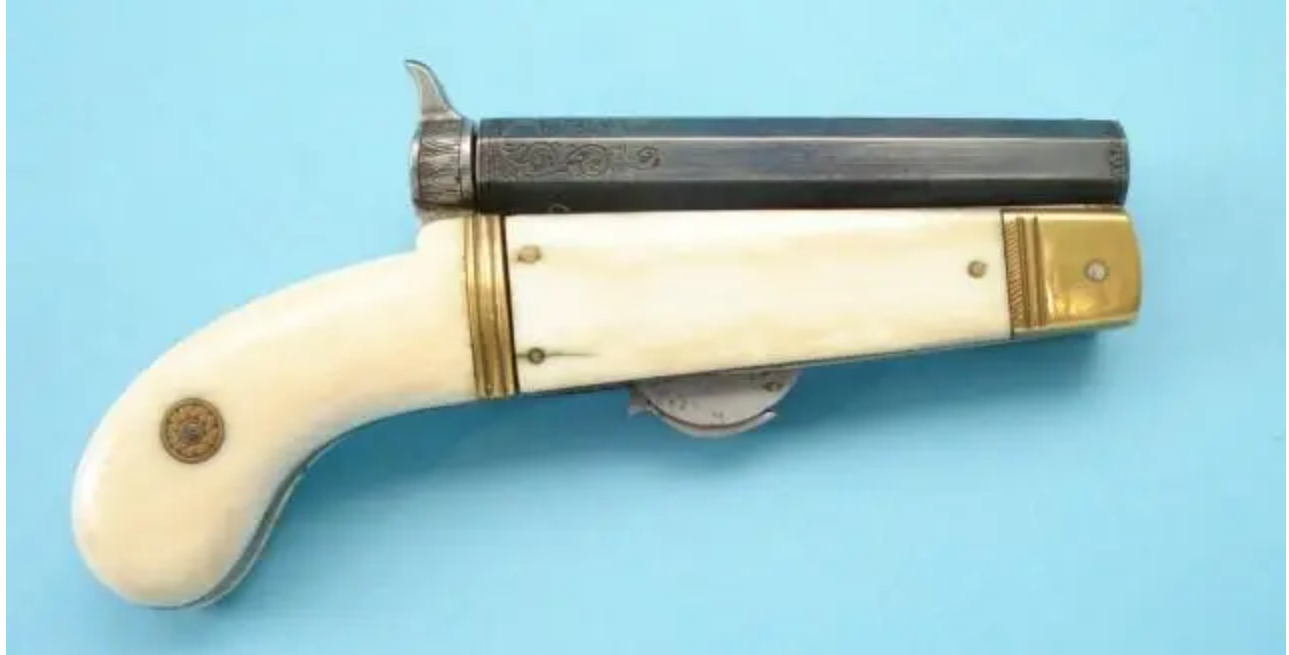
Nožová pistole bratří Linsleyů z Leedsu.

Tento doplněk je ale skutečně originální a zajímavý. Faktem je, že boční desky jsou odstraněny zatlačením dopředu. Jejich odstraněním získáte jak nůž, tak vidličku. To znamená, že s jejich pomocí můžete snídat nebo obědovat a pak někoho zastřelit!