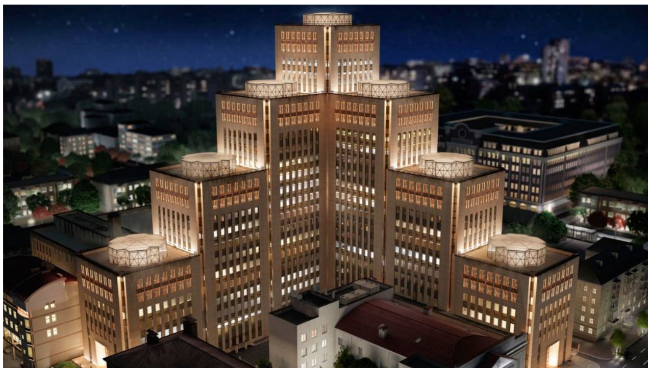
Menorah – největší židovské komunitní centrum na světě