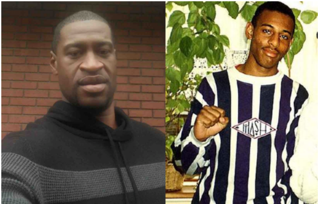
George Floyd a Stephen Lawrence, černí svatí v protibílých mučednických kultech