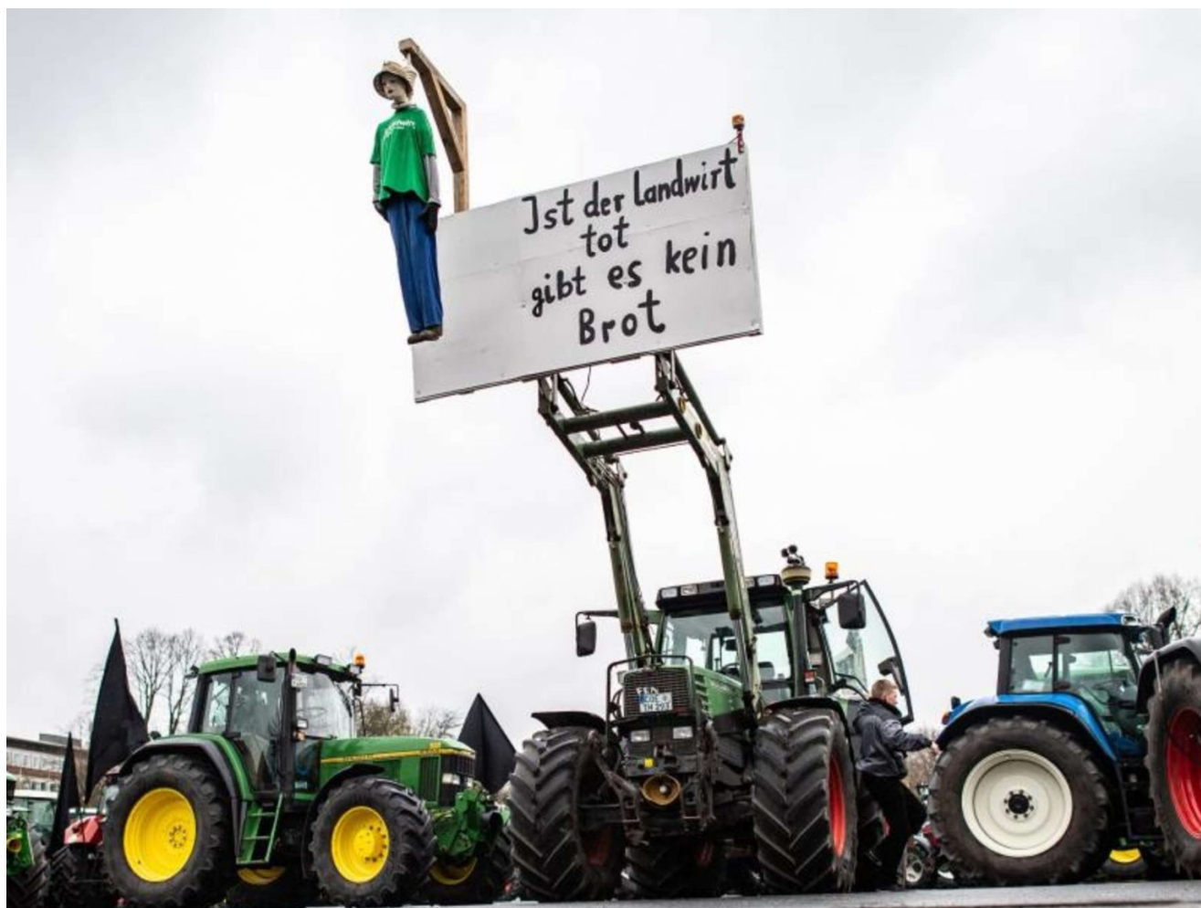
Foto z demonstrace německých zemědělců.

Aby tento článek nebyl příliš dlouhý nechám si do dalšího dílu informace o tom, čím Evropská komise zdůvodňuje „nutnost“ sjednání těchto obchodních dohod. Při čtení v jednom dni by se řadě z Vás mohlo zdravotně přitížit.