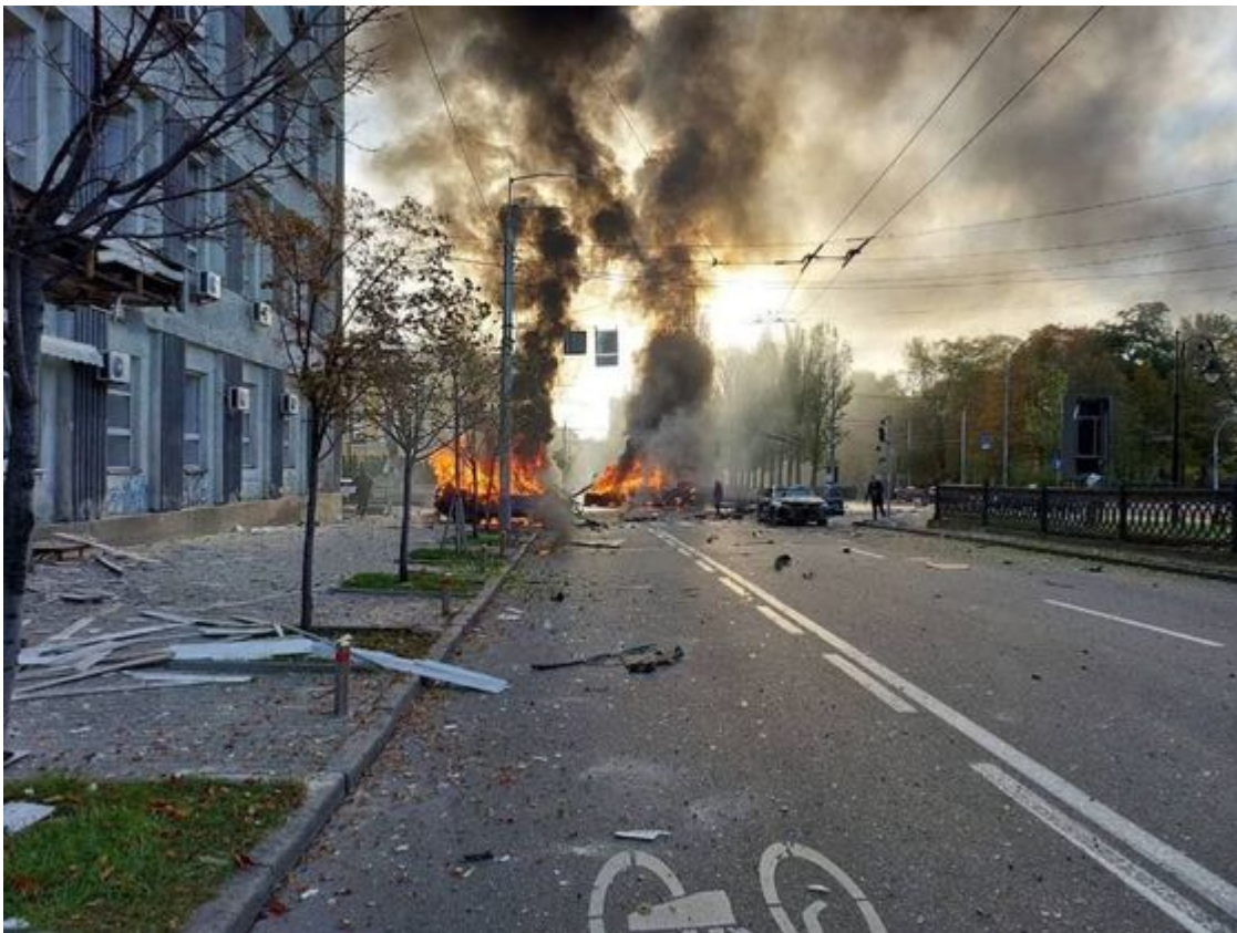
Kyjev. Ráno 10. října

10. října je navštívil skutečný strach, který se snažil ze svého bunkru rozptýlit idiot Arestovič, který své spoluobčany nezapomenutelně přesvědčoval, že raketové útoky jsou „drobné nepříjemnosti“ a že jsou pro Ukrajinu jenom dobré.