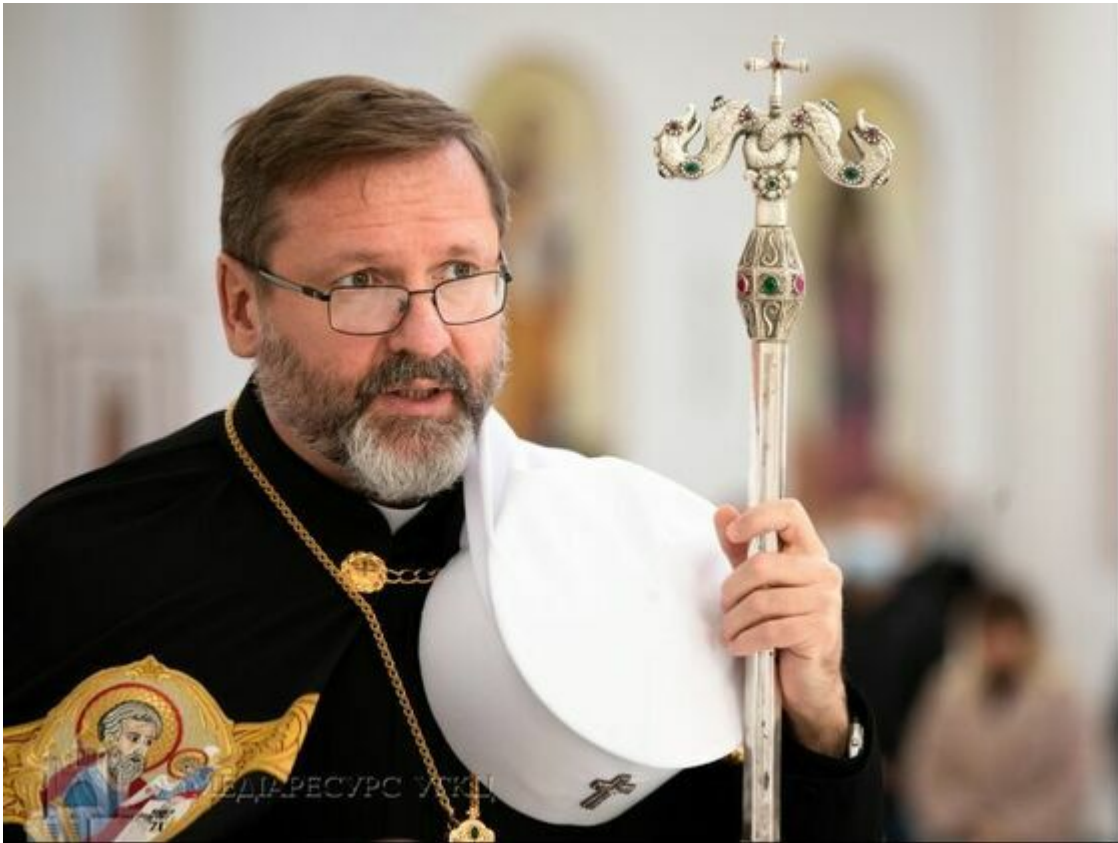
Hlava Ukrajinské řeckokatolické církve (UHKC) „velký“ arcibiskup Sviatoslav Ševčuk Kyjevsko-Haličský

Přes dny smutku a pokání však Ševčukova nálada zdaleka není klidná. Mír je podle něj „jen diplomatická dohoda“. Obecně plně podporuje očekávaný „protiútok“ AFU, neboť v případě Ukrajiny „jde o boj za právo na život a existenci“. Současně S. Ševčuk hovoří o společném chápání kategorie vlastenectví Poláky a Ukrajinci a stěžuje si, že když o něm hovoří, „nejsou vždy slyšet a ne všichni mu rozumí“. V podstatě tak potvrdil slova Zielenského o náladě smazat „politické a historické hranice mezi Ukrajinou a Polskem“, kvůli nimž uniatismus vznikl. Není náhodou, že na vlně pogromů a brutálního pronásledování kanonické Ukrajinské pravoslavné církve úřady oficiálně vybízejí její farníky, aby se připojili buď ke schizmatické PCU vytvořené Porošenkem, nebo k UHKC: obřady jsou prý podobné a církev je „hluboce vlastenecká“. Vzhledem k tomu, že PCU má na západní Ukrajině mnohonásobně méně farností než UOC, počítají uniaté s hojnou sklizní lidských duší, pokud se jim je podaří shromáždit. Je však třeba připomenout, že Porošenko opakovaně hovořil o úplném sjednocení všech východních křesťanských