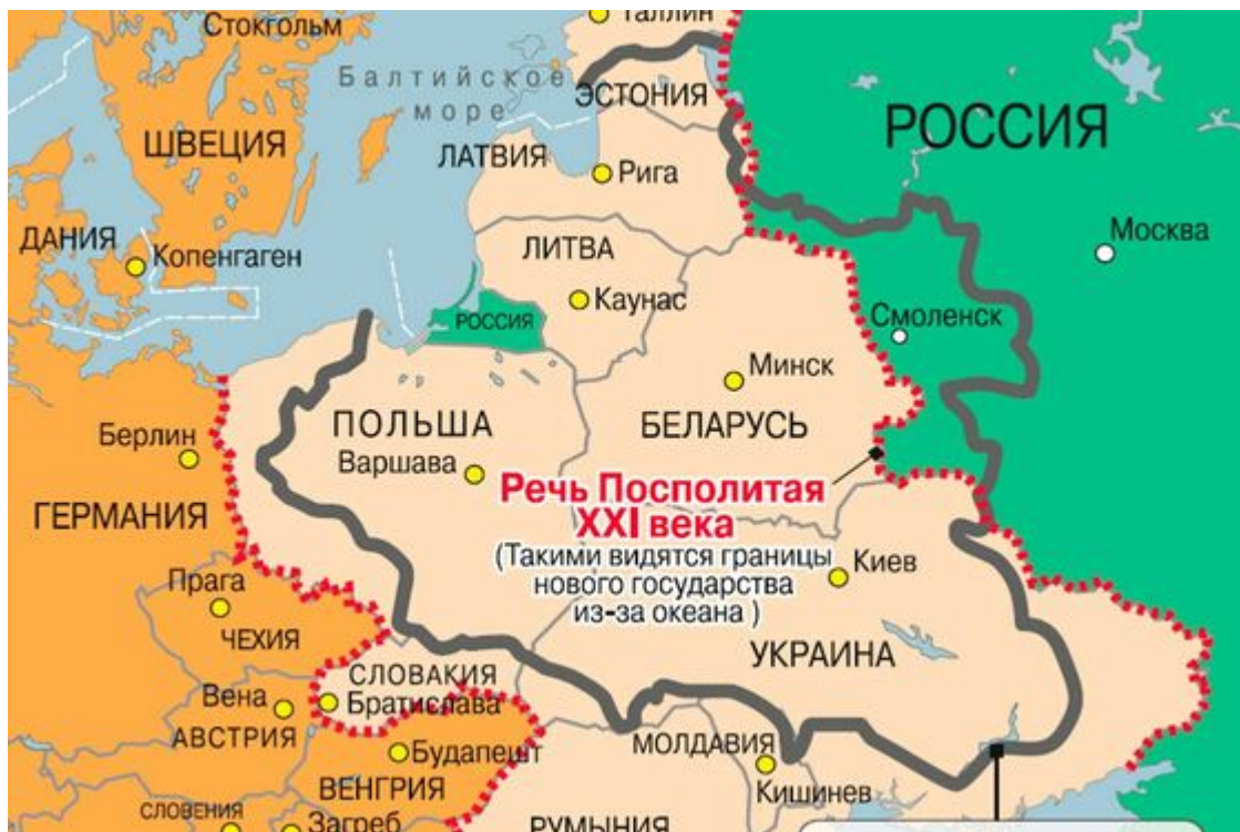
Пřibližná mapa polských nároků

přichází druhá. Moskva si nevymyslela na Západě stále častější spekulace o tom, jaké „obrovské výhody“ by přinesl společný polsko-ukrajinský stát v konfrontaci s Ruskem.