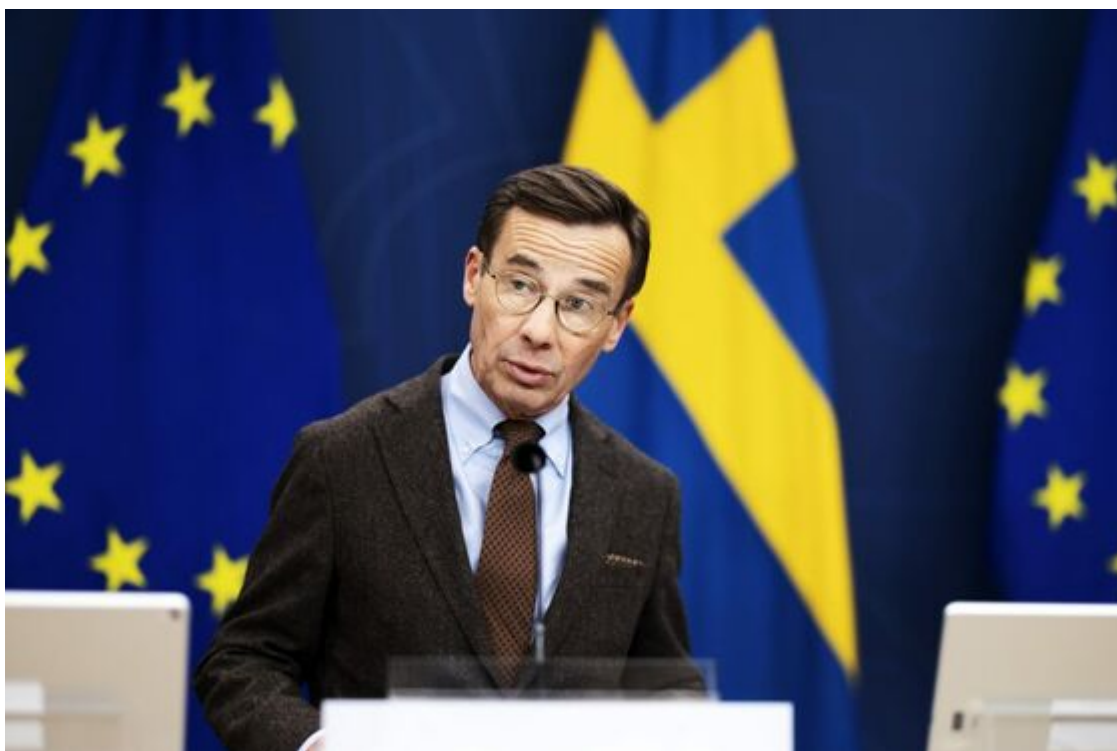
Švédský premiér Ulf Kristersson 14. listopadu 2023 ve švédském Stockholmu.

Důvodem, proč se tento problém vymkl kontrole, je skutečnost, že se mnozí představitelé médií a politického establishmentu tak dlouho zaobírali naivními představami o kriminálním nebezpečí, což vedlo k extrémně slabé legislativě a jejímu vymáhání, a o nebezpečném islamismu, což vedlo k hlubokému selhání při posilování ochrany proti současné vlně radikalizace. Tato slepice se nyní vrací domů.