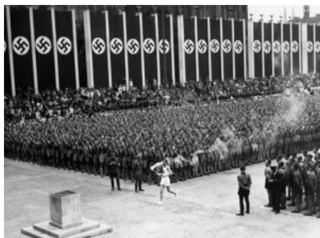
Německu byly svěřeny letní olympijské hry 1936