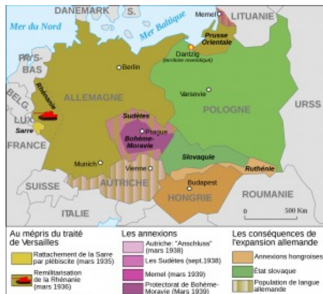
Mapa expanze Reichu 1935-1939

Na první pohled se zdá, že na tom není nic sporného. Jen drobné detaily, pár maličností budí podezření. Nacistické Německo rozjelo zuřivou propagandistickou kampaň mezi populací regionu a dokonce i v samotné Francii. Ale z Paříže žádná agitace vidět nebyla. Ba co víc, francouzský ministr zahraničí, Pierre Laval, dva dny před referendem tvrdil, že „Francii jeho výsledek nezajímá“. Není těžké si představit, jaký dojem to muselo mít na skupiny obyvatel Sárska, kteří vedli boj za připojení k Francii. Britští diplomaté přispěli svoji troškou do mlýna též. Zaujali velmi „podivný“ postoj tím, že se silně stavěli proti myšlence, aby Sársko zůstalo pod správou Ligy národů. Britové tvrdili, že to pro předchůdce dnešní OSN je přílišná zátěž. Tudíž výsledek referenda z 13. ledna 1935 byla předem rozhodnutá záležitost. Nakonec hlasovalo pro sjednocení s Německem 90% lidí.