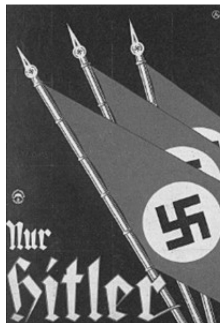
Británie, Francie a USA se dlouho a silně pokoušely najít způsoby, jak legálně být porodní bábou Hitlerova politického vítězství v Německu. Nacistický volební plakát.

A v tomto absurdistánu se objevil vůdce a strana, který celý tento cirkus odmítl. Jen toto jim získalo sympatie. „Marxistické strany a jejich spojenci měli 14 let na to, aby ukázali, co umí. Výsledkem je hromada trosek,“ tvrdil Hitler, když spílal svým soupeřům kvůli stavu jeho země.