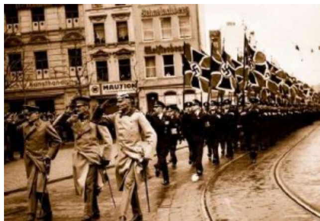
Německé jednotky vstupující do Polska, 1936

Když vycítil smířlivý postoj Západu, začal se Hitler chovat drzeji a „Hanfstaenglové“ obklopující Führera ho ujišťovali, že může nadále jednat s naprostou beztrestností. 7. března 1936 poslal německé jednotky do demilitarizovaného Porýní. Žádná mocnost neměla právo mít jednotky v této oblasti, která byla oddělena od Německa, aby se vytvořila nárazníková zóna mezi touto zemí a Francií. A přesto Hitler bezostyšně porušoval mezinárodní dohody. Proč si byl tak jistý, že mu nehrozí odplata?