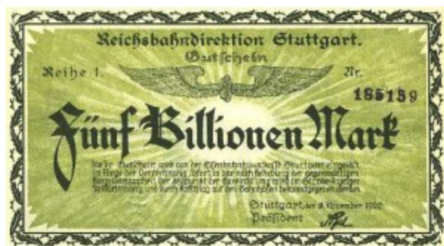
Bankovka 5 bilionů marek, Německo, 1923

Možná si vzpomenete, že v r. 1923 německý obchodník a mecenáš umění, Ernst Hanfstaengl , který pracoval pro americkou tajnou službu, pomohl Adolfu Hitlerovi koupit tiskařský lis a začít velkovýrobu svých nacistických novin. Zatímco Führer sám si byl celkem sebejistý a fantazíroval (doslova) o revoluci, také nepostřehnutelně absorboval Hanfstaenglovy myšlenky o potřebě německého přátelství s Amerikou a Velkou Británií.