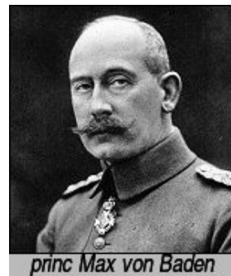
princ Max von Baden

A spal docela dlouho! Déle, než kdokoliv jiný na světě. Dokonce i ti nejunavenější a nejvyčerpanější. O tomto „zázraku“ se v učebnicích nedočtete: historici přehlíží fakta, která vám nedokážou vysvětlit. Informace lze najít v pamětech britského premiéra Lloyda George. Nejen, že kancléř spal mimořádně dlouho, ale vlastně během té doby Německo prohrálo válku!