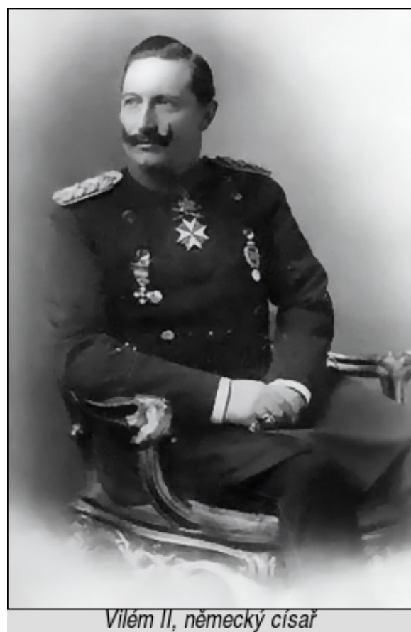
Wilém II, německý císař

Vláda „spícího“ prince Maxe byla u moci pouze něco přes měsíc. A během tohoto měsíce dokázal tak hbitě ztratit nejdříve všechny spojence Německa, a pak samotné Německo! To