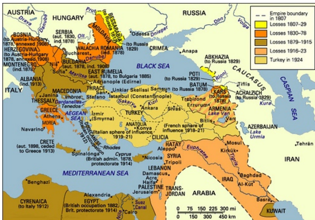
Osmanská říše v letech 1820-1924