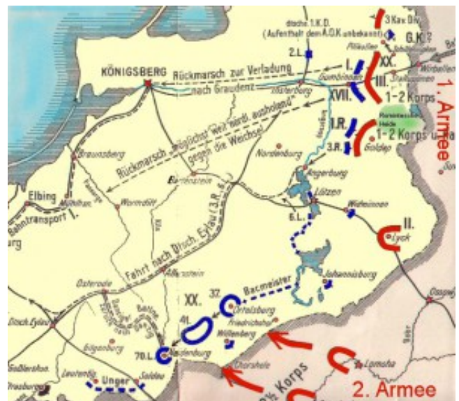
Mapa bitvy u Gumbinnenu

Do Paříže zbývalo méně než padesát kilometrů. Žár války byl takový, že francouzské velení se chápalo jakékoliv příležitosti, jak zastavit svého nepřítele. Na počátku září 1914 téměř 600 pařížských taxíků, během několika cest, přivezlo na frontu asi 6,000 francouzských vojáků. A dokonce i tato malá posila sehrála roli: na řece Marne se Němci náhle zarazili a začali s odsunem. Historici to nazvali „zázrak na Marne“. Ve skutečnosti to však žádný zázrak, co zachránilo Paříž, nebyl. Paříž byla zachráněna desítkami tisíc zmasakrovaných a uvězněných Rusů. Během nejprudší bitvy o Paříž vtrhly na území východního Pruska dvě ruské armády pod velením generálů Samsonova a Rennenkampfa. Po prohře v bitvě u Gumbinnen začali poražení Němci ustupovat a nejvyšší velení německé armády bylo nuceno odsunout téměř 100,000 vojáků z jejich postupu na Paříž a nasadit je proti Rusům. Výsledkem tohoto nepřipraveného útoku bylo obklíčení a zničení celé ruské armády. Neschopen nést ostudu se generál Samsonov zastřelil.