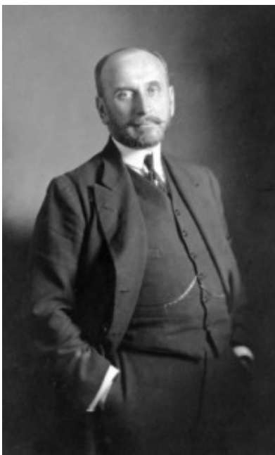
Ruský imperiální ministr zahraničí Sergej Sazonov

Zatímco válečná štěstěna se na Rusko nesmála, ruští diplomaté se pokoušeli probrat otázku poválečného uspořádání světa se svými spojenci. Jedinou možnou kořistí pro Rusko ve válce byly ceněné turecké průlivy, které fungovaly jako špunt a blokovaly výjezd ruské flotily z Černého moře. Angličané to věděli moc dobře. Byli to Angličané, kdo stovky let bránil Rusku zničit Turecko a zmocnit se Bosporu a Dardanel. A nyní je použili jako návnadu. „Extrémní potřeba posílit Rusko po jeho selhání ve východním Prusku,“ napsal Winston Churchill ve „Světové krizi“, „donutila Edwarda Greye, britského ministra zahraničí, aby dal pokyn Buchananovi, našemu velvyslanci v Petrohradu, aby již 14. listopadu 1914 informoval Sazonova, že vláda uznala, že záležitost týkající se průlivů a Konstantinopole musí být vyřešena v souladu s přáním Ruska.“