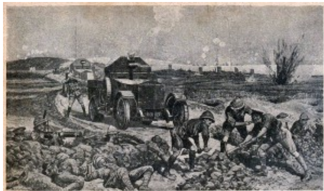
Britské obrněné Rolls Roycey v Dardanelách, 1915