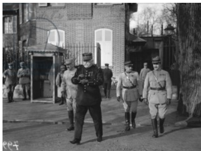
Maršál Joffre v Chantilly, 1915

Z nějakého důvodu se historici vyhýbají zajímavému vzorci: bez ohledu na to, která země vstoupila do války, a nezáleželo dokonce ani na tom, na které straně byla, bylo Rusko jedinou zemí, která si pohoršila!