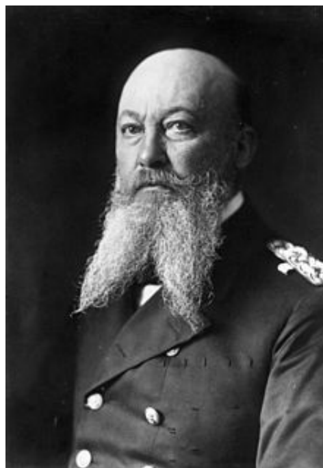
Alfred von Tirpitz (1849-1930)

Plán „spojenců“ fungoval dokonale – Rusko a Německo se vzájemně oslabovaly. Německý útok začal v lednu 1915 a pokračoval téměř nepřetržitě víceméně do konce léta. V důsledku toho ruské jednotky byly nuceny vzdát se Haliče, která byla obsazena dříve, a utrpěly významné ztráty. Nicméně to však nebyla katastrofa. Fronta držela pevně a opuštění Polska, po porážce v Haliči, bylo plánovanou operací pro posílení frontové linie. Německá armáda se také vyčerpala – ruská fronta pohltila všechny jejich připravené rezervy.