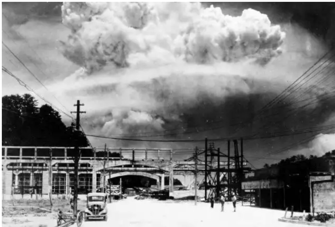
Pohled na oblak vytvořený výbuchem atomové bomby nad Nagasaki z cca 15 km vzdáleného Kôjadži-Džima (Kôyaji-Jima), zdroj: topwar.ru/waralbum.ru