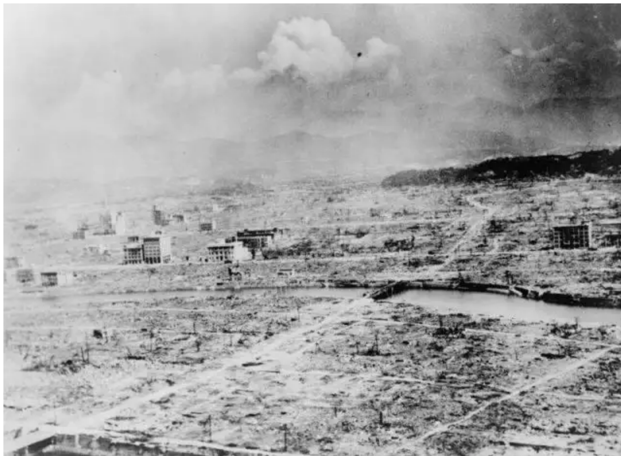
Panorama zničeného japonského města Hirošima po bombardování atomovou bombou

Rozhodujícím faktorem, který přinutil Japonské císařství složit zbraně, bylo (prý) použití atomových bomb Američany. Ti, kteří tak tvrdí, si však zároveň zavírají oči před skutečností, v níž se Japonci, císař i vojenské velení, nehledě na Američany použité atomové zbraně, ani zdaleka nechystali kapitulovat. Japonské vojensko-politické špičky zatajily před vlastním obyvatelstvem fakt, že Američané použili zcela novou, zničující zbraň, a pokračovali v přípravách země bojovat „do posledního Japonce“. Otázka bombardování Hirošimy nebyla dokonce rozebírána ani na zasedání Nejvyšší rady vojenského velení. Varování Washingtonu, podle kterého byli Američané připraveni, počínaje 7. srpnem 1945, uskutečňovat další bombardování s použitím atomových bomb, vnímali v Japonsku jako projev nepřátelské propagandy.