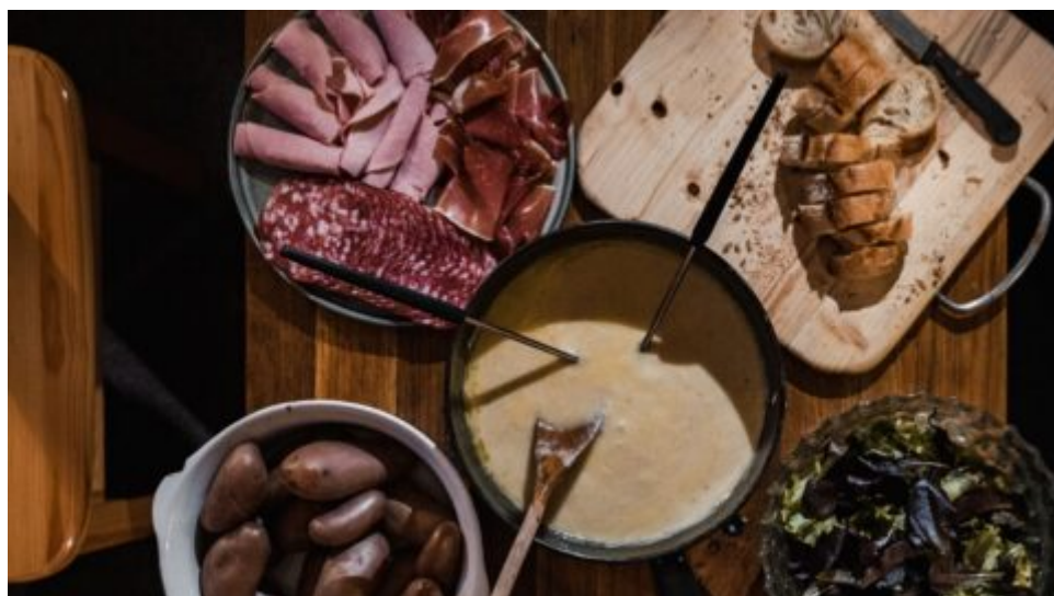
Fondue – sýrový pozdrav ze Švýcarska