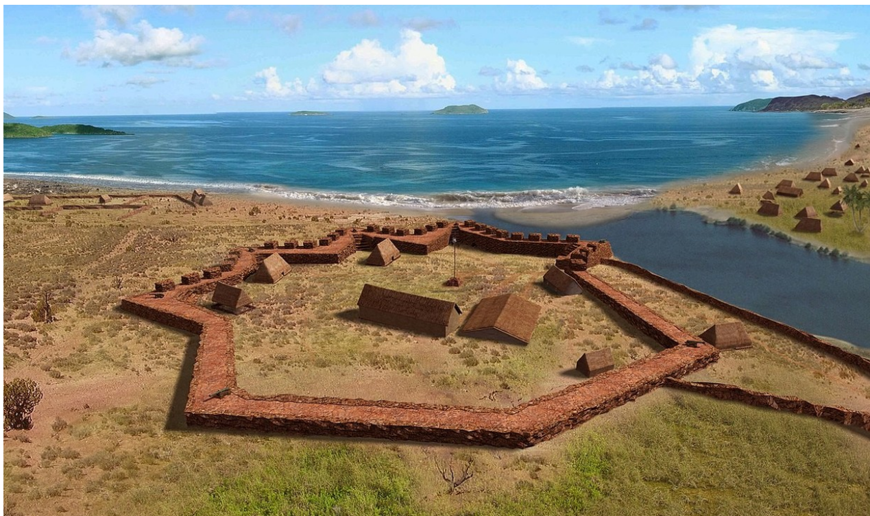
Alžbětinská pevnost. Pohled na pevnost z ptačí perspektivy. Reconstruction by A. Molodin and P. Mills, 2015.

Doktor také koupil dvě americké lodě s plnou důvěrou, že jeho úspěchy více než vrátí náklady a nákup bude silně podporován jeho vedením. Když bývalí majitelé lodí dorazili do Novo-Arkhangelska a ukázali smlouvu Baranovovi, rozzuřil se. Místo toho, aby vrátil 100 000 rublů, Schaffer nashromáždil dluhy společnosti ve výši dalších 200 000.