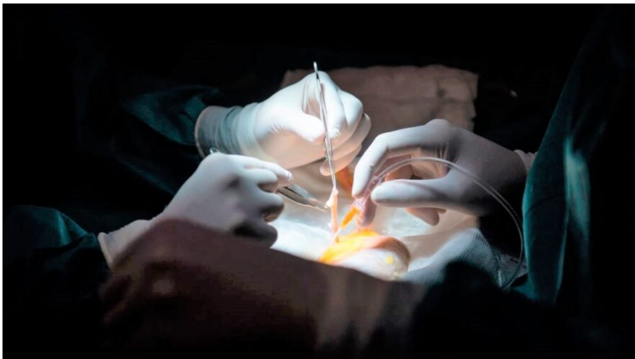
Lékaři se připravují na transplantaci ledviny.

Čína, která vstoupila do oblasti mezinárodní transplantační komunity na přelomu tisíciletí, zaznamenala v posledních dvou desetiletích prudký nárůst transplantací orgánů, přestože počet dobrovolných dárců je nízký.