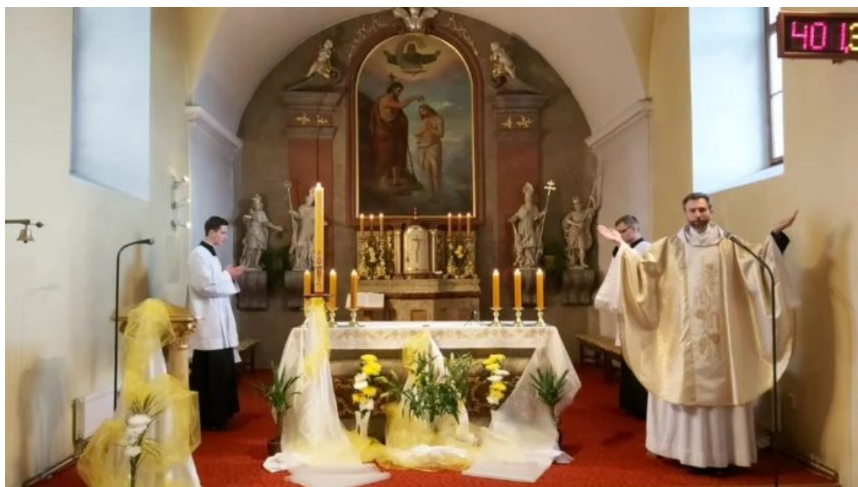
Bohoslužba v kostele v Rokytnici.

Když kněz v kostele vyhrožuje a dělí kandidáty na prezidenta na demokratické a nedemokratické Na záběry z videa se nedá prostě říct nic dalšího, jenom s hrůzou lze konstatovat, že se vrací duch nacismu a fašistických procesů do České republiky a dokonce už i do kostelů stejně, jako tomu bylo před vypuknutím II. sv. války v Evropě, zejména v Německu, ale později i v Československu. Církevní hodnostáři kázali proti Židům, velebili kroky Říše na ochranu čistoty církve atd. Zpronevěření Písmu zejména ze strany římsko-katolické církve v dobách nacismu je historicky dobře zdokumentováno. Ovšem nikoho by nenapadlo, že proces fašizace je v ČR už tak daleko, že přímo v kostelech při bohoslužbách zaznívají slovní útoky proti části obyvatel, kteří přímo od oltáře jsou knězem dehonestováni, je jim de facto vyhrožováno a přímo kněz burcuje do volby druhého a údajně demokratického kandidáta.