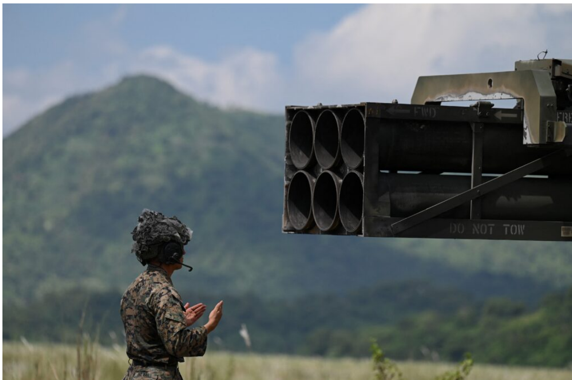
Mezinárodní média zůstala soustředěně zaměřena na dodávky západních zbraní, včetně amerických raketometů Himars

Podle informací poskytnutých společností WELT za dodávky zaplatily USA a Velká Británie.