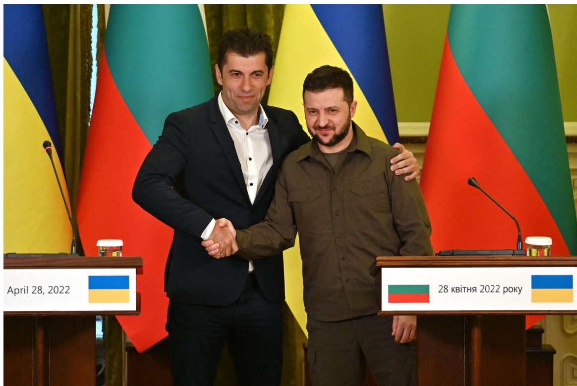
Ukrajinský prezident Volodymyr Zelenskyy s bývalým premiérem Bulharska Kirilem Petkovem