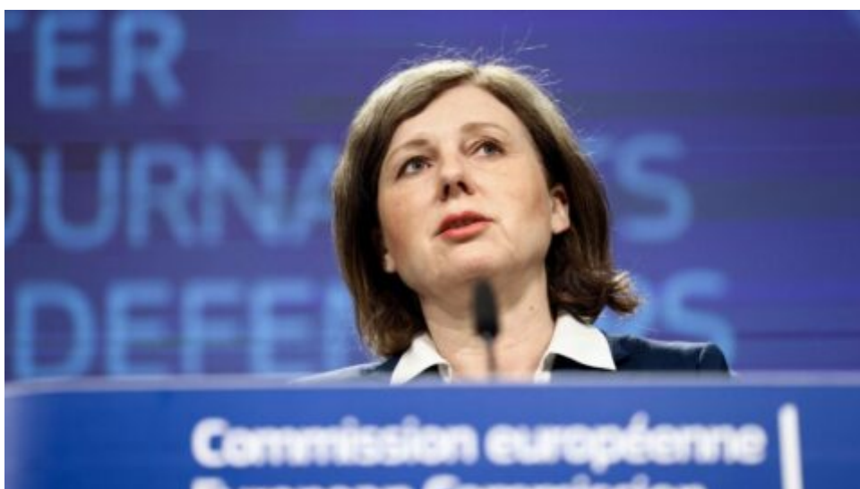
Jourová na setkání Světového ekonomického fóra v Davosu předpověděla, že zákony o nenávistných projevech budou brzy i v USA