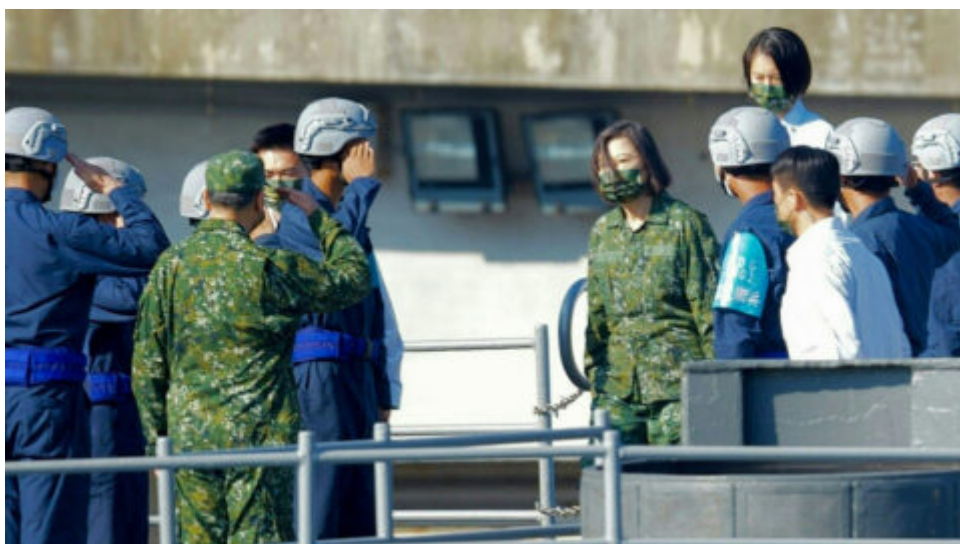
Tchaj-wan otevírá výcvik pro vojenské záložnice po provokacích Komunistické strany Číny.