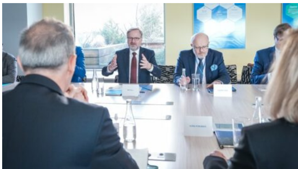
Vláda ČR řeší nedostatek léčiva přímo s farmaceutickou společností