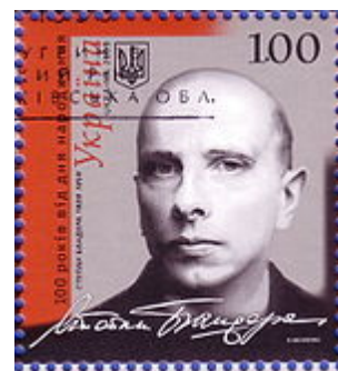
Stepan Bandera. Ukrajinská známka s jeho portrétem vydaná v roce 2009.

ukrajinského prezidenta Viktora Juščenka ocenit titulem Hrdina Ukrajiny Banderu a vyjádřil naději, že by to mohlo být znovu přehodnoceno.