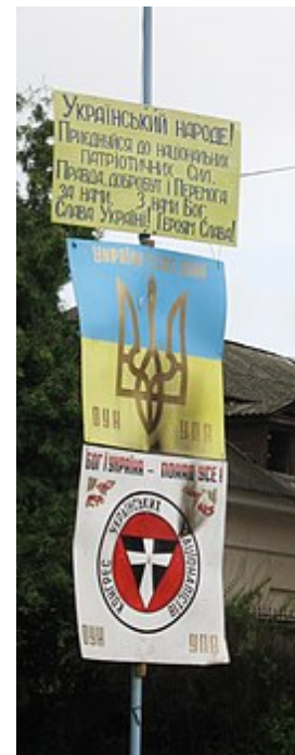
„Bůh a Ukrajina nade vše.“ Plakáty OUN v západoukrajinském Počajivu, 2007