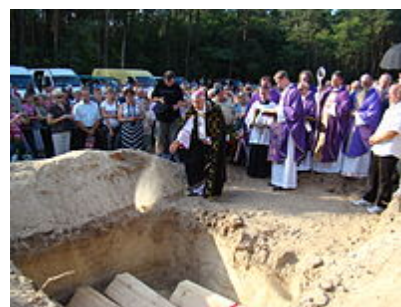
Katolický pohřeb exhumovaných obětí masakru ve volyňské vesnici Ostrówki. 30. srpna 1943 zde UPA zavraždila 483 Poláků, včetně 246 dětí.

Na jaře 1944 UPA přesunula hlavní působiště do východní Haliče a pokračovala ve vyvraždování. Celkový počet polských civilistů (včetně žen, dětí a nemluvňat) povražděných UPA během války (oběti byly často před smrtí brutálně mučeny) se odhaduje na 80 000–130 000. Vedení polských partyzánů (AK) důrazně zakázalo svým jednotkám provést odvetné akce proti ukrajinským civilistům, některé oddíly, ve kterých sloužili blízcí zavražděných polských civilistů neuposlechly rozkazu a vypálily několik ukrajinských vesnic (np. Sahryn). Za obětí nekoordinovaným polským odvetným útokům padlo odhadem kolem 10–15 000 Ukrajinců (členů OUN-UPA i civilistů - bestialita zdokumentovaná u mnoha činů ukrajinské UPA zde nebyla odhalena ani prokázána). [9] V letech 1943–45 rozpoutaly UPA partyzánskou válku jak proti jednotkám Rudé armády , tak proti Němcům . Nejznámější akcí jednotek UPA byl přepad kolony štábu velitele frontu Rudé armády generála armády Vatutina , při kterém byl tento významný velitel vážně zraněn a zakrátko zemřel. Hlavním článkem UPA byly kurině, tj. prapory, které byly rozděleny na 4–6 sotní, tj. rot. Velitelský kádr UPA byl složen ze zkušených velitelů, z nichž řada byla