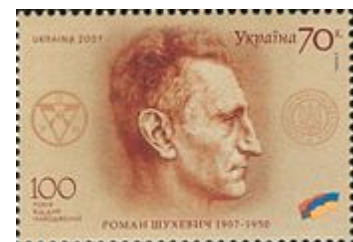
Ukrajinská známka s portrétem Romana Šuchevyče