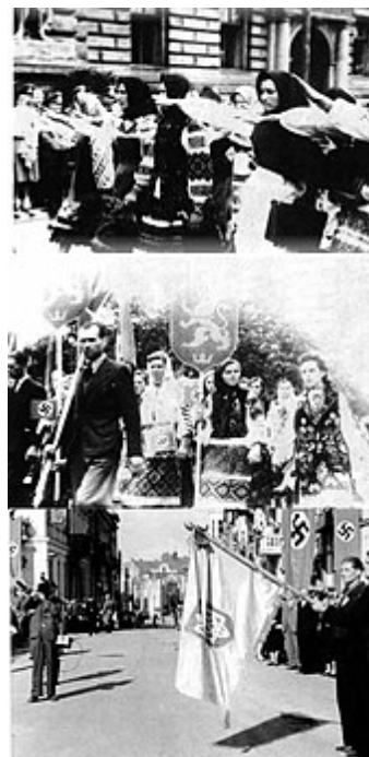
V roce 1941 ukrajinští nacionalisté vítali Němce a organizovali pogromy proti Židům ve Lvově

Představitelé těchto radikálů, mezi něž patřil Stepan Bandera , Roman Šuchevyč , Jaroslav Stecko a další, požadovali nekompromisní boj a partyzánskou válku za samostatnost Ukrajiny. V srpnu 1939 se konal v Římě sněm OUN, v němž získali převahu stoupenci Andreje Melnyka, který byl opětovně zvolen jejich předsedou. V únoru roku 1940 uspořádali radikálové vlastní sněm, který neuznal závěry římského sněmu a rozhodl o vytvoření revolučního výboru OUN, do jehož čela byl zvolen Stepan Bandera . Toto znamenalo rozkol, kdy vedle sebe současně stály melnykovská (OUN-M) a banderovská (OUN-B) OUN. Zatímco melnykovci počítali s podporou Německa, banderovci prosazovali myšlenku vytvoření ukrajinské nezávislosti vlastními silami. Obě skupiny však zastávaly názor, že případný vojenský střet Německa se SSSR může v konečném důsledku vést k vytvoření nezávislé Ukrajiny.