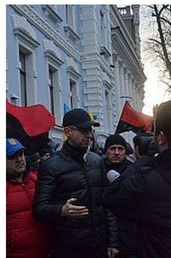
Arsenij Jaceňuk blokuje sídlo ukrajinské vlády během Euromajdanu , 2013. V pozadí vlajky UPA .