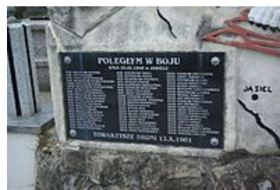
Pomník polským vojákům, kteří zahynuli 20. března 1946 u obce Jasiel v boji proti UPA

Sovětská NKVD se snažila likvidovat osoby, které těmto oddílům pomáhaly, a to včetně představitelů řeckokatolické církve, u níž mělo OUN velkou podporu. OUN nadále řídil Stepan Bandera , který měl svůj štáb v americké okupační zóně v Německu a podle něhož byly jednotky UPA nazývány jako „banderovci“. Využíval toho, že se mezi zeměmi východního a západního bloku rozpoutala studená válka a že západní země podporovaly nezávislost Ukrajiny . Pod silicím tlakem sovětských ozbrojených sil v letech 1945 až 1946 se většina jednotek UPA přemístila do jihovýchodních oblastí Polska , obývaných ukrajinskou menšinou, kde měli banderovci vybudovány silné pozice. Tam rozpoutali partyzánskou válku, při níž nejvíce trpělo civilní obyvatelstvo. V srpnu 1945 vyhlásila polská vláda amnestii pro ty, kteří se vzdají a přihlásí se orgánům státní moci, čehož využilo pouze 42 tisíc osob.