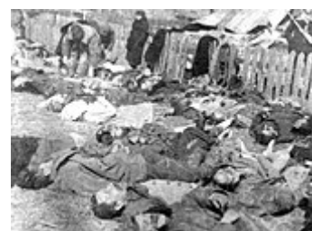
Mrtví polští civilisté z Volyně , které zavraždila UPA