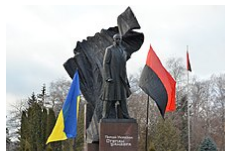
Monument Stepanu Banderovi v Ternopilu