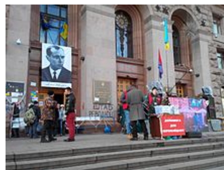
Hlavní štáb Euromajdanu v budově obsazené kyjevské radnice, 14. ledna 2014

Dne 22. ledna 2010 byl Bandera oceněn titulem Hrdina Ukrajiny za „obranu národní ideje a boj za nezávislý ukrajinský stát“. Ocenění předal ukrajinský prezident Viktor Juščenko do rukou vnuka Stepana Bandery. Samotné předání ocenění bylo tvrdě kritizováno Evropským parlamentem, Izraelem a Ruskem , jehož tisková agentura ITAR-TASS oznámila, že „ozbrojenci z UPA mají na svědomí množství zločinů, mezi nimi vyvraždění víc než 100 000 Poláků , Čechů a Židů v západní Volyni “. Udělení titulu odsoudili a označili za provokaci také představitelé slovenských protifašistických a odbojových organizací a Sdružením vězňů nacistických koncentračních táborů. [1] Ocenění bylo odsouzeno i Centrem Simona Wiesenthala a Studentskou unií francouzských Židů. Dne 25. února 2010 také Evropský parlament kritizoval rozhodnutí Juščenka ocenit titulem Hrdina Ukrajiny Bandera a vyjádřil naději, že by to mohlo být znovu přehodnoceno. [2]