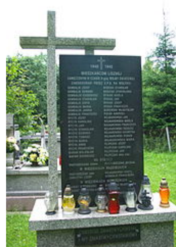
Pomník Polákům z vesnice Liszna, které zavraždila UPA

V září 1928 se přestěhoval do Lvova a zapsal se na agronomické oddělení Vysoké školy polytechnické, kde studoval až do roku 1933. Zabýval se běháním, plaváním, vařením piva (českého typu), cestováním a divadlem. Ve volném čase se věnoval šachům, zpíval ve sboru a hrál na kytaru a mandolínu. Nekouřil a nepil alkohol.