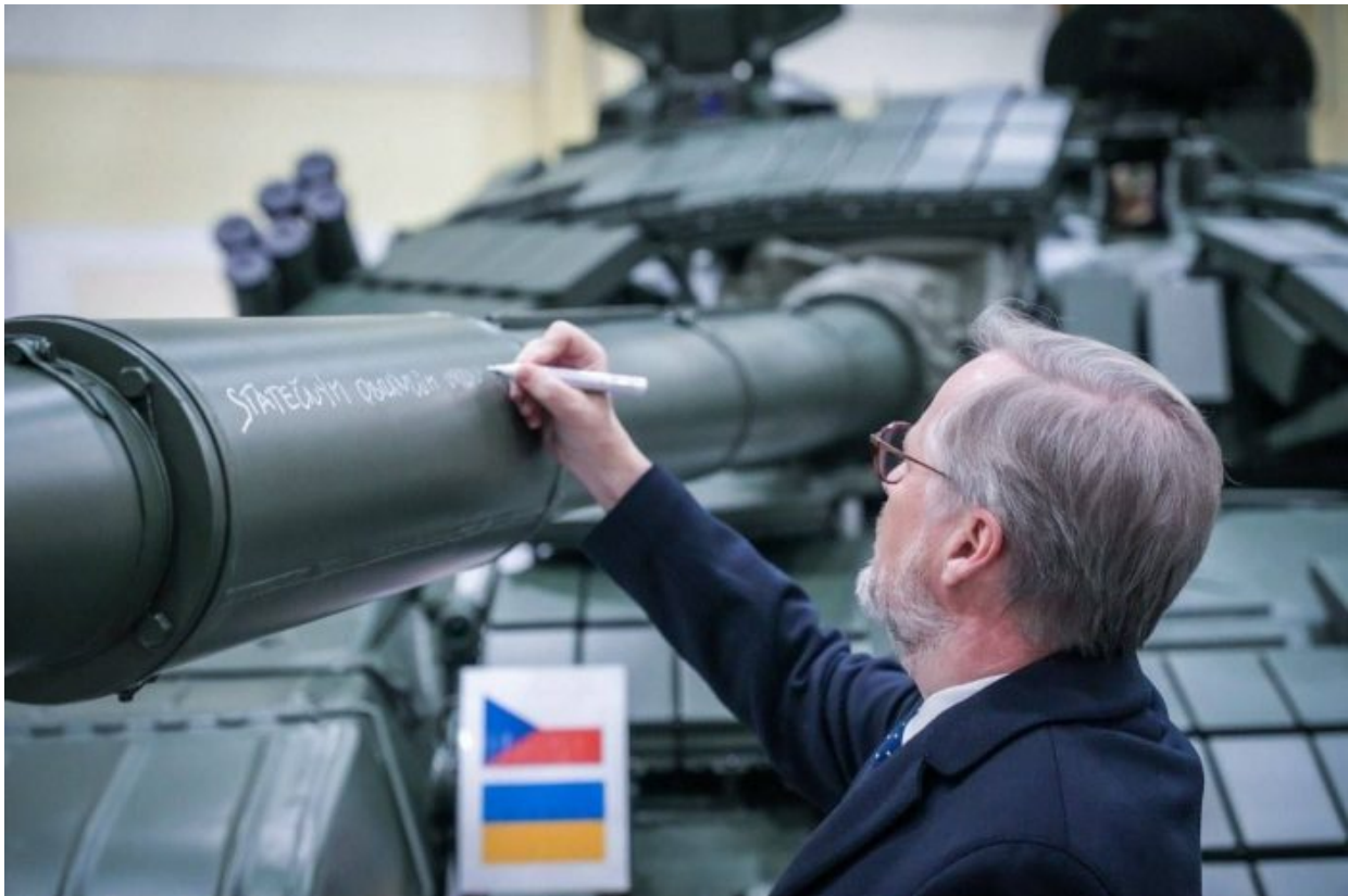
Žehnání zbraním před odesláním na frontu

alternativní média. Změna DNS serverů je nejsnadnější řešení, protože je to řešení zdarma, nemusíte nic platit a ani měnit prohlížeč webu.