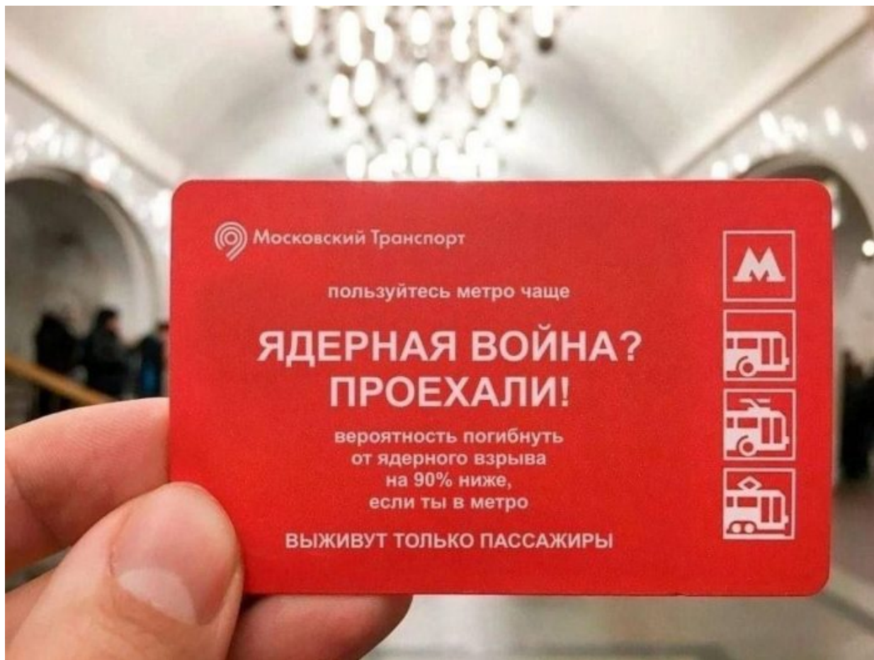
Síťová karta moskevského dopravního podniku

Pravděpodobnost úmrtí v důsledku jaderné exploze je o 90% nižší, pokud se nacházíte v metru. Přežijí pouze pasažéři (metra).