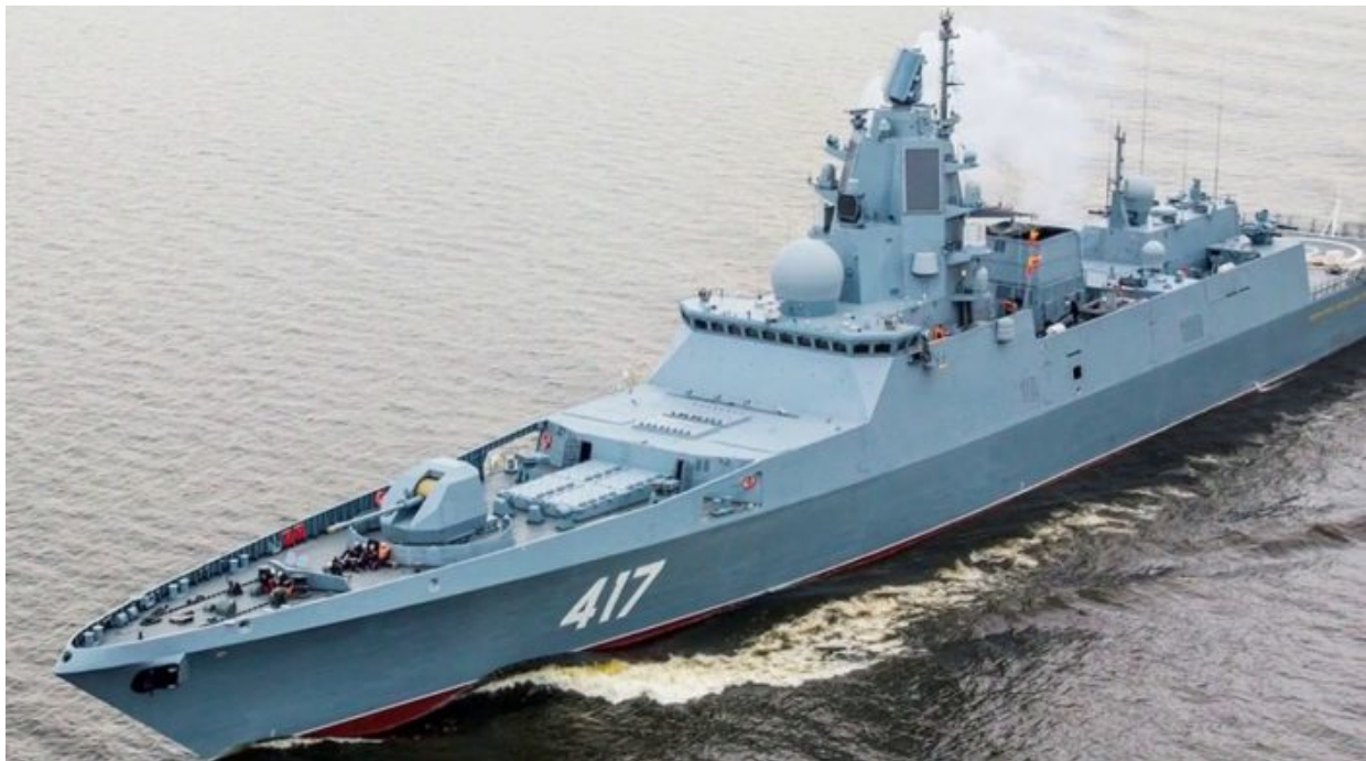
Fregata Admirál Groškov

Odeslání Leopardů na Ukrajinu není pro Rusko hrozbou ve smyslu té techniky jako takové. Hrozbou je totiž samotný fakt a odhodlání západu posílat na Ukrajinu těžší a účinnější zbraně, bez omezení, což dnes může začínat několika desítkami tanků, ale může to končit dodávkami střel dlouhého doletu a dokonce i rozmístěním vojsk NATO na území Ukrajiny a hrozbou, že NATO spolu s nimi rozmístí na Ukrajině pod svojí kontrolou i jaderné taktické zbraně.