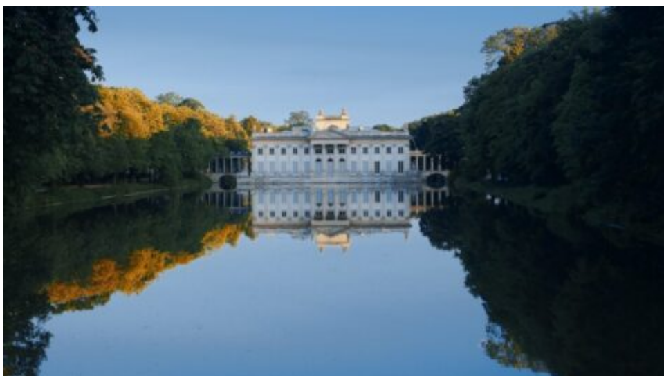
Letné sídlo posledného poľského kráľa: Kráľovský palác Lazienki