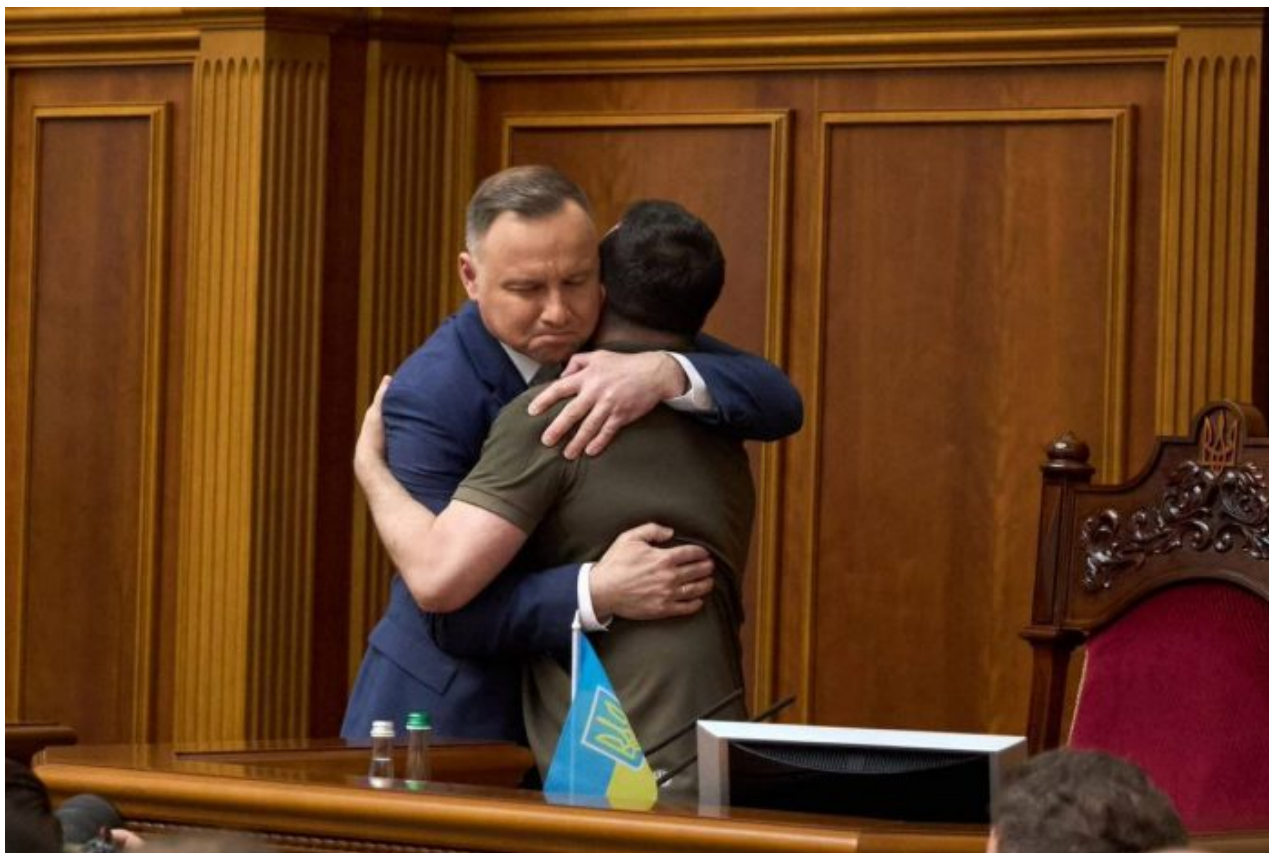
Prezidenti Andrzej Duda a Volodymyr Zelenský

říkat, co chce, protože není veřejným představitelem. Z toho si můžete odvodit, v jaké skutečné situaci se celá Ukrajina ve válce nachází. Po vyhazovu pravá ruka Zelenského prohlašuje, že vítězství nad Ruskem je velmi nepravděpodobné. Narovinu, bez okolků.