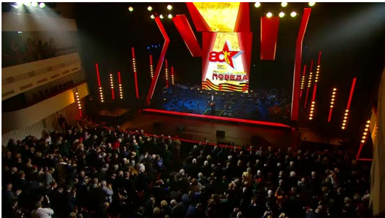
Projev probíhal v divadle ve Volgogradu

Bestie nechce přijít o vlastní kožich, a proto štěká a kibicuje ostatní, aby oni běželi vstříc pod hlavně děl nepřítel. Nikdo z těch politiků, až na vzácné a raritní výjimky v počtech, které spočítáte na prstech jedné ruky, maximálně dvou, nevolá po míru. Všichni volají do války a porážky Ruska, jako kdyby nešlo o největší zemi na světě s jednou z největších armád, jako kdyby nešlo o jadernou velmoc, jako kdyby šlo o nějakou banánovou republiku, do které je možné poslat “ mírové okupační mise ” NATO. Ruští pozorovatelé na ruské televizi, především v pořadu Vladimira Solovjeva, mluví už otevřeně o nevyhnutelnosti přímého konfliktu s NATO kvůli Ukrajině. Jde prý už jen o to, kdy k tomu dojde a kde nastane ten spouštěcí incident.