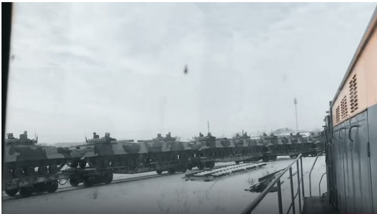
Echelon s bojovými vozidly pěchoty BMP-3 (c) snímek z videa Rostec.

Bojová vozidla pěchoty BMP-3 jsou aktivně využívána ruskou armádou během speciální vojenské operace. Zejména je známo bojové použití komplexu protitankových řízených střel osádkou jednoho z bojových vozidel.