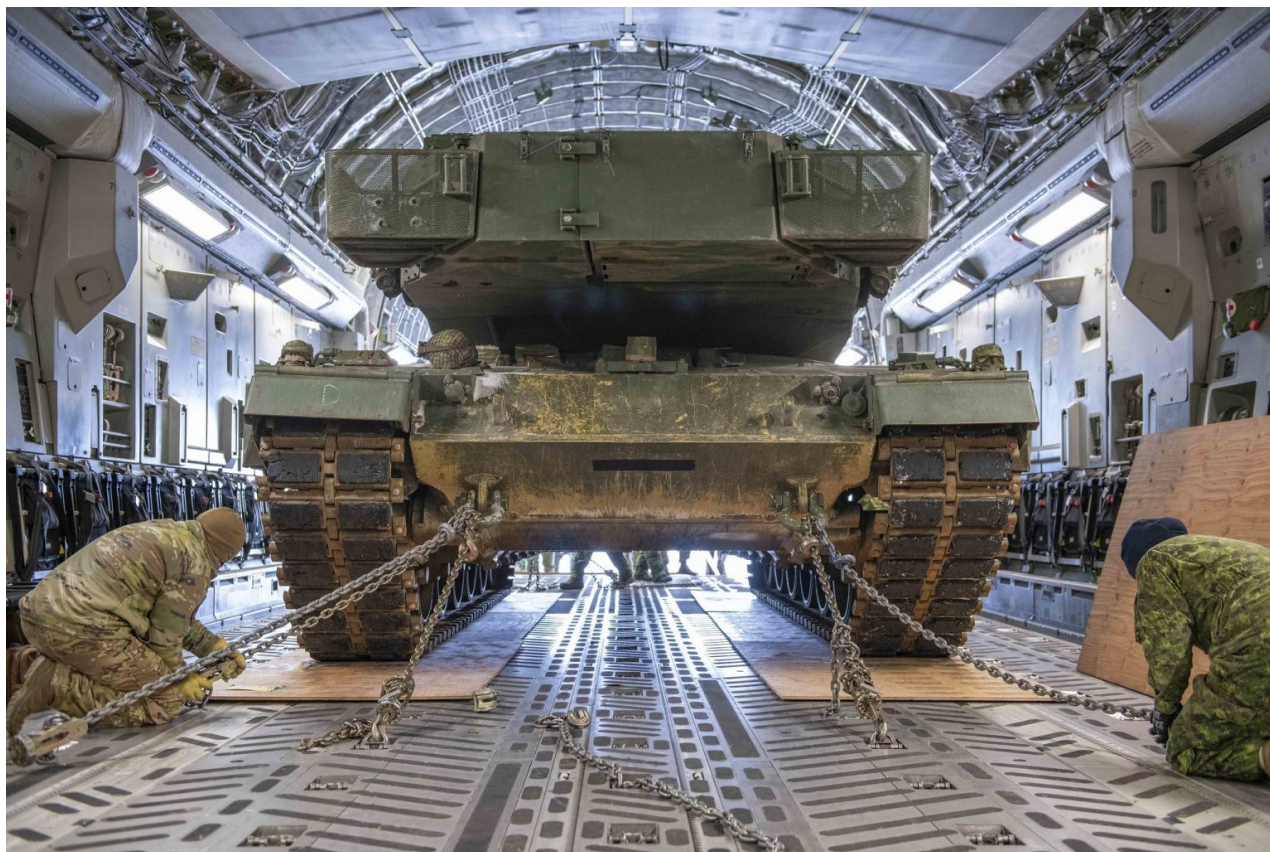
Kanadský Leopard 2A4 uvnitř vojenského dopravního letadla Boeing C-17A

Kanadské vojenské oddělení vyslalo do Evropy první tank Leopard 2A4 určený k přesunu ukrajinským jednotkám v rámci vojenské pomoci.