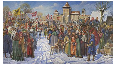
Kongres evropských panovníků v Lucku , 1429

Podle legendy pochází Luchesk ze 7. století . První známá písemná zmínka pochází z roku 1085. Město sloužilo jako hlavní město knížectví Halych-Volynia (založeno v roce 1199) až do vzestupu Volodymyra . Město vyrostlo kolem dřevěné pevnosti postavené místní větví dynastie Rurik . V určitých obdobích fungovalo místo jako hlavní město knížectví, ale město se nestalo významným centrem obchodu ani kultury.