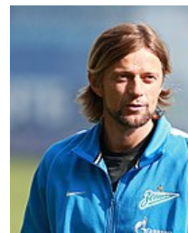
Anatolij Tymoshchuk , 2017