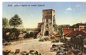
Lubartův hrad , 1916