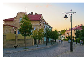
Staré město Luck