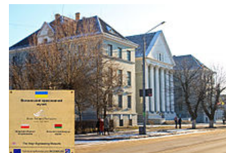
Volyňské vyhlídkové muzeum