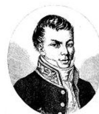
Alojzy Feliński , 1862