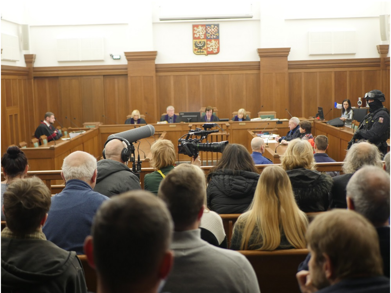
Veřejnost a soudní senát.