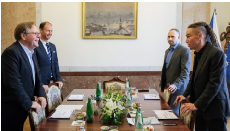
Ministr Bartoš jednal se šéfem Erste Group o prioritách české vlády v oblasti bydlení