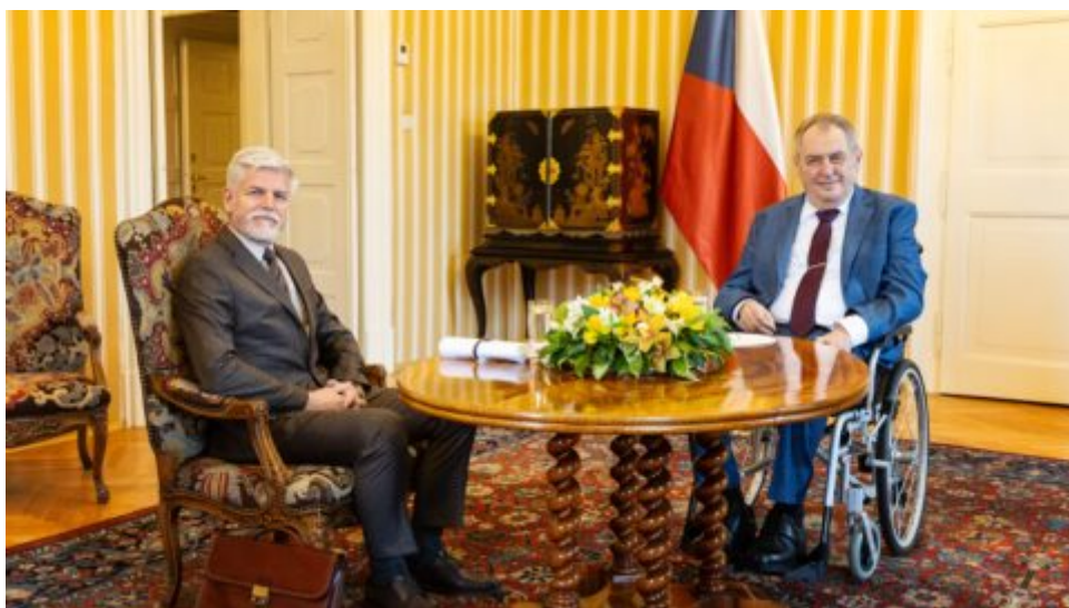
V Lánech se uskutečnila schůzka obou prezidentů ČR