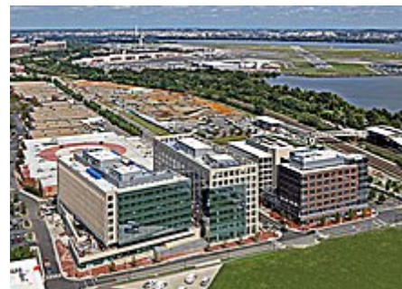
Arlington County IDA Potomac Yard

V roce 2018 společnost Amazon.com, Inc. oznámila, že vybuduje své společné ústředí v sousedství Crystal City a zakotví tak širší oblast Arlingtonu a Alexandrie, která byla současně přejmenována na National Landing . [34]