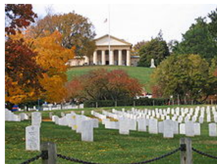
Na Arlingtonově pečeti, vlajce a logu se objevuje fasáda Arlington House (pozadí), kdysi rezidence generála Konfederace Roberta E. Lee .