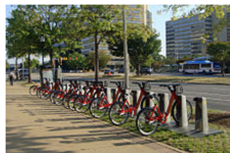
Služba sdílení kol v Arlingtonu poskytovaná společností Capital Bikeshare nedaleko Pentagon City

V roce 2007 kraj povolil nové taxislužbě EnviroCAB provozovat výhradně hybridní-elektrický vozový park čítající 50 vozidel a rovněž vydal povolení stávajícím společnostem přidat do svých vozových