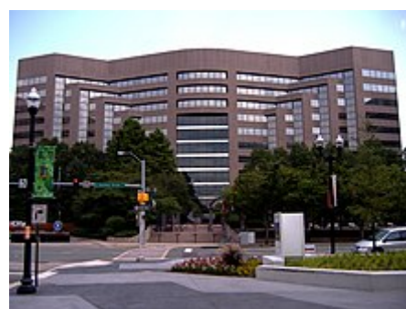
Park Four, bývalé ústředí US Airways v Crystal City .

Společnosti se sídlem v Arlingtonu zahrnují Amazon ( jeho druhé ústředí ), AES , Alcalde a Fay , Arlington Asset Investment , AvalonBay Communities , CACI , Corporate Executive Board , FBR Capital Markets , Interstate Hotels & Resorts , Pacific Architects and Engineers , Rosetta Stone a Nestlé USA . Boeing 5. května 2022 oznámil, že přesune své globální sídlo do Arlingtonu. [115] 7. června 2022 Raytheon oznámila přemístění svého globálního ústředí do Arlingtonu. [116]