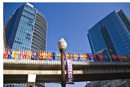
1812 N Moore (vpravo) a Turnberry Tower (vlevo)

Arlington má trvale nejnižší míru nezaměstnanosti ze všech jurisdikcí ve Virginii. [103] Míra nezaměstnanosti v Arlingtonu byla v srpnu 2009 4,2 %. [104] 60 % kancelářských prostor v koridoru Rosslyn-Ballston je pronajato vládním agenturám a vládním dodavatelům. [105] V roce 2008 bylo v kraji odhadem 205 300 pracovních míst. Asi 28,7 % z nich bylo ve federální, státní nebo místní vládě; 19,1 % technické a odborné; 28,9 % ubytování, stravování a další služby. [106]