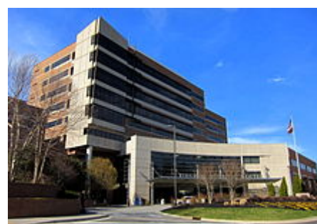
Virginia Hospital Center, pátý největší zaměstnavatel v Arlington County