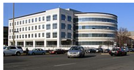
Právnická fakulta Antonina Scali na Univerzitě George Masona

Arlington Public Schools provozuje krajský veřejný vzdělávací systém K-12 s 22 základními školami; 6 středních škol ( Dorothy Hamm Middle School , Gunston Middle School , Kenmore Middle School , Swanson Middle School , Thomas Jefferson Middle School a Williamsburg Middle School ) ; a 3 veřejné střední školy ( Wakefield High School , Washington-Liberty High School a Yorktown High School ). HB Woodlawn a Arlington Tech jsou alternativní veřejné školy. Arlington County utrácí asi polovinu svých místních příjmů na vzdělávání. Pro rozpočet FY2013 bylo 83 procent financování z místních příjmů a 12 procent od státu. Očekává se, že