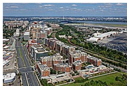
Národní brána okresu Arlington