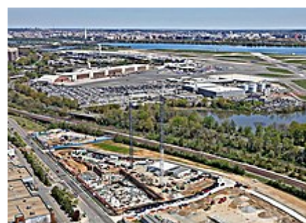
Arlington County Virginia Tech Inovativní kampusový projekt