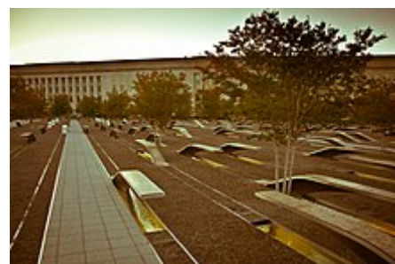
Památník Pentagonu z 11. září .

Budova má tvar pětiúhelníku a sídlí v ní asi 23 000 vojenských a civilních zaměstnanců a asi 3 000 podpůrného personálu mimo obranu. Má pět pater a každé patro má pět prstencových chodeb. Hlavním orgánem vymáhání práva v Pentagonu je policie Pentagonu Spojených států , agentura, která chrání Pentagon a různé další jurisdikce DoD v celé oblasti národního hlavního města.