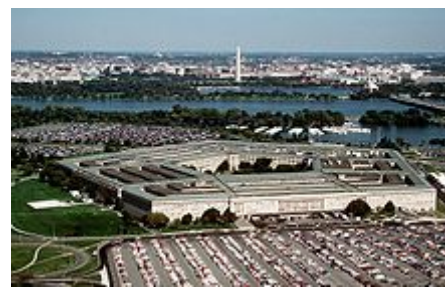
Pentagon při pohledu na severovýchod s řekou Potomac a Washington Monument v dálce

Pentagon v Arlingtonu je ředitelství ministerstva obrany Spojených států . Byla zasvěcena 15. ledna 1943 a je to největší kancelářská budova na světě. Ačkoli to je lokalizováno v Arlingtonu, poštovní služba Spojených států vyžaduje to “Washington, DC” být používán jako jméno místa v poště adresovaném k šesti PSC přiřazeným k Pentagonu. [120]