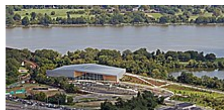
Vodní a fitness centrum Arlington County