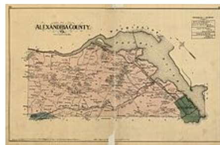
1878 mapa okresu Alexandria nyní (s odstraněním Alexandrie ) okres Arlington

V 1870, město Alexandrie stalo se legálně oddělené od okresu Alexandrie dodatkem k ústavě Virginie, která dělala všechna Virginie začleněná města (ale ne začleněná města ) nezávislá na krajích kterého oni předtím byli část. Kvůli zmatku mezi městem a stejnojmenným krajem začalo hnutí přejmenovat Alexandrijský kraj. V 1920, jméno Arlington kraj byl přijat, po Arlington domu , domov americké občanské války generál společníka Robert E. Lee , který stojí na základě čeho je nyní Arlington národní hřbitov . Město Potomac bylo začleněno jako město v Alexandrii County v roce 1908. Město bylo připojeno k Alexandrii v roce 1930.