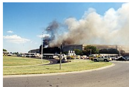
Kouř stoupající z Pentagonu po útocích z 11. září .

V roce 2017 si Nestle USA vybralo 1812 N Moore v Rosslynu jako své americké sídlo. [33]