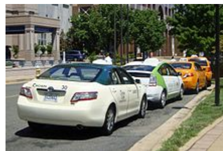
Několik hybridních taxíků v Pentagon City .

parků 35 hybridních kabin. Po zahájení provozu v roce 2008 se EnvironCab stal první flotilou plně hybridních taxíků ve Spojených státech a společnost nejen kompenzovala emise generované svou flotilou hybridů, ale také ekvivalentní emise 100 nehybridních taxíků v provozu v USA. Metropolitní oblast. [132].[133]