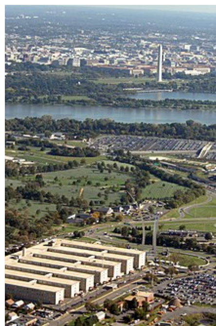
Bývalý přístav námořnictva a památník letectva