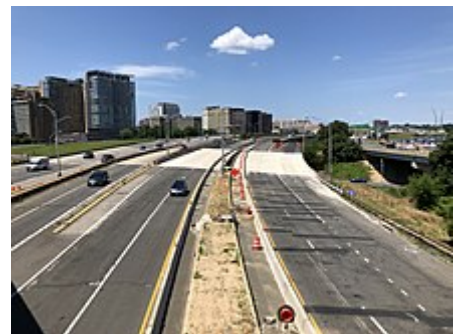
I-395 na jih v Arlingtonu, poblíž Pentagonu