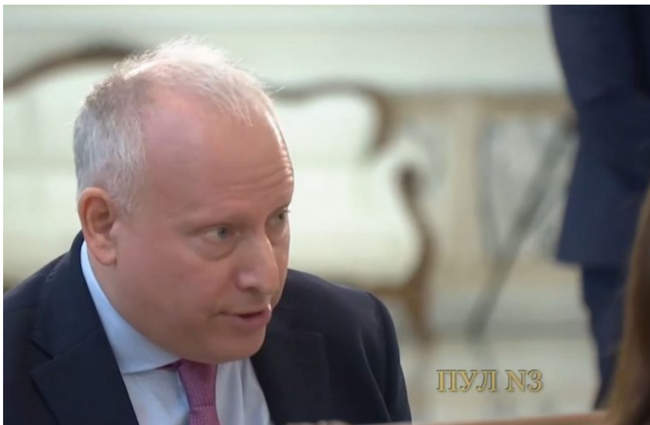
Redaktor BBC Steve Rosenberg

Tato metodika znamená jednu věc, že Rusy se nepodaří Kyjevu z Ukrajiny vytlačit, a to proto, že už dávno nejde o Ukrajinu. Kremlu jde o porážku a demilitarizaci Evropy a zemí NATO v Evropě. A to znamená, že Londýnské kanceláře musí změnit plán. A tím plánem je rozdělení Ukrajiny, přičemž na tu rozdělenou část pod kontrolou Londýna se jako rakovina rozleze Evropská unie a hned po ní NATO.