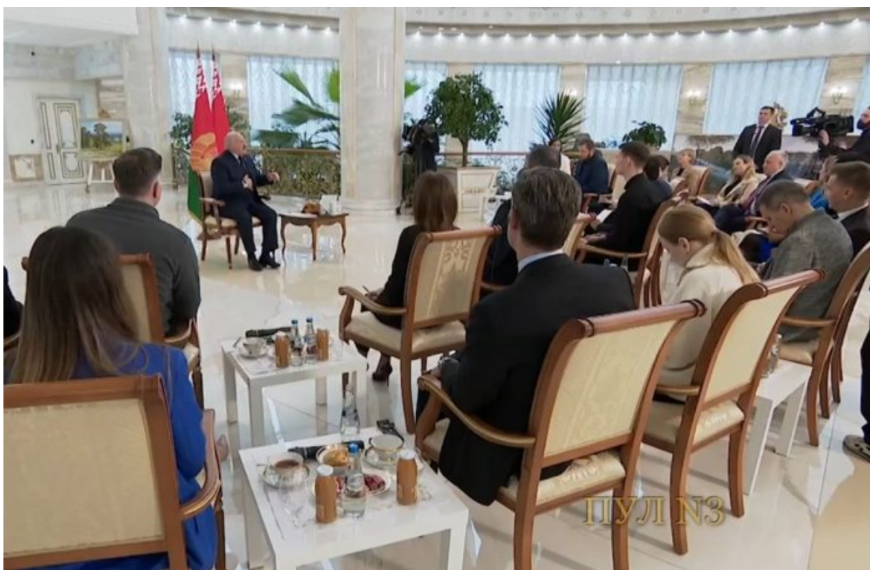
Tisková konference Alexandera Lukašenka

Zelenský je sice zfetovaný od rána do večera, ale jedno je mu jasné, že když pozve na Ukrajinu vojska NATO, nice jiného než rozdělení Ukrajiny od toho okamžiku nepřipadá v úvahu. A to Zelenský nechce, protože by tím de facto přiznal, že by šlo o okupaci vojsky NATO. Výrok Lukašenka o tom, že za krátký čas zajistí bezpečnost Bělorusku i Ukrajině, je třeba vnímat jako signál, jakou hrozbu by rozdělení Ukrajiny představovalo nejen pro Moskvu, ale i pro Minsk.