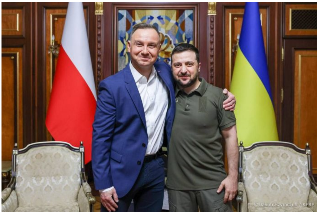
Andrzej Duda a Volodymyr Zelenský

A to není všechno. Slovenská média v pátek informovala [3], že okresní úřady rozesílají firmám a podnikům dopisy, ve kterých je žádají o jmenné seznamy všech mužů starších 18 let v souladu s branným zákonem. Tyto žádosti jsou prý rozesílány každý rok, že prý není důvod se znepokojovat, jenže pozor, není to tak jednoduché, jak by se mohlo zdát.