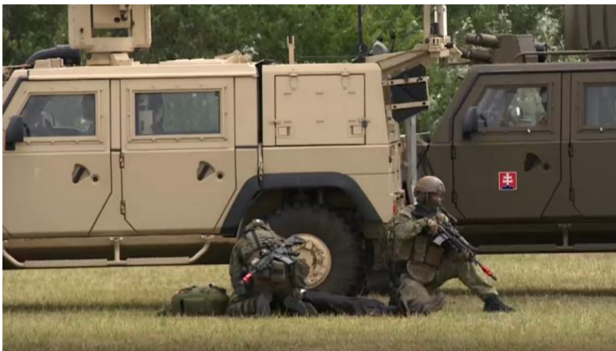
Cvičení slovenské armády

Dále tato mapa zjistí pracovníky v oboru slévačství a obrábění kovů, což jsou klíčové profese pro válečné úsilí v mobilizaci a ve válce. Mapa zjistí lékařské profese přesně podle určení na dané mapě. Zejména má armáda zájem o lékaře z oboru traumatologie. Rovněž se zjistí řidiči z povolání, které je možné povolat při mobilizaci za účelem řízení nákladních aut a autobusů pro účely mobilizace.