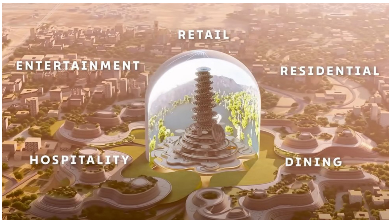
Spirálová věž uvnitř Mukaabu. Nová společnost Murabba Development Company