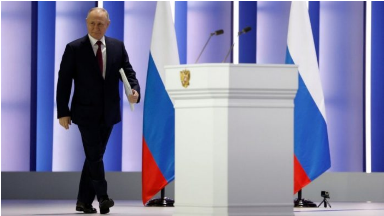
Vladimir Putin při projevu o stavu federace, 21. února 2023

Putinův projev znovu popsal realie vztahu Evropy a Ruska, znovu přesně vystihl hrozbu konfrontace, která se blíží mílovými skoky. Západ byl v roce 2019 na pokraji ekonomického kolapsu a kdyby nepřišel Covid-19, propukla by obrovská ekonomická krize a recese. Evropa potřebuje nové odbytové trhy, potřebuje nový kolaps Sovětského svazu, potřebuje nové a nenasycené odbytové trhy pro evropské a americké zboží. A takovým nenasyceným prostorem je v dnešní době už jen jediná země, a to je Rusko. Představa jeho rozbití na desítky menších států podle modelu rozmlácené Jugoslávie na počátku 90. let je přesně tím plánem sionistů z Londýnských kanceláří.