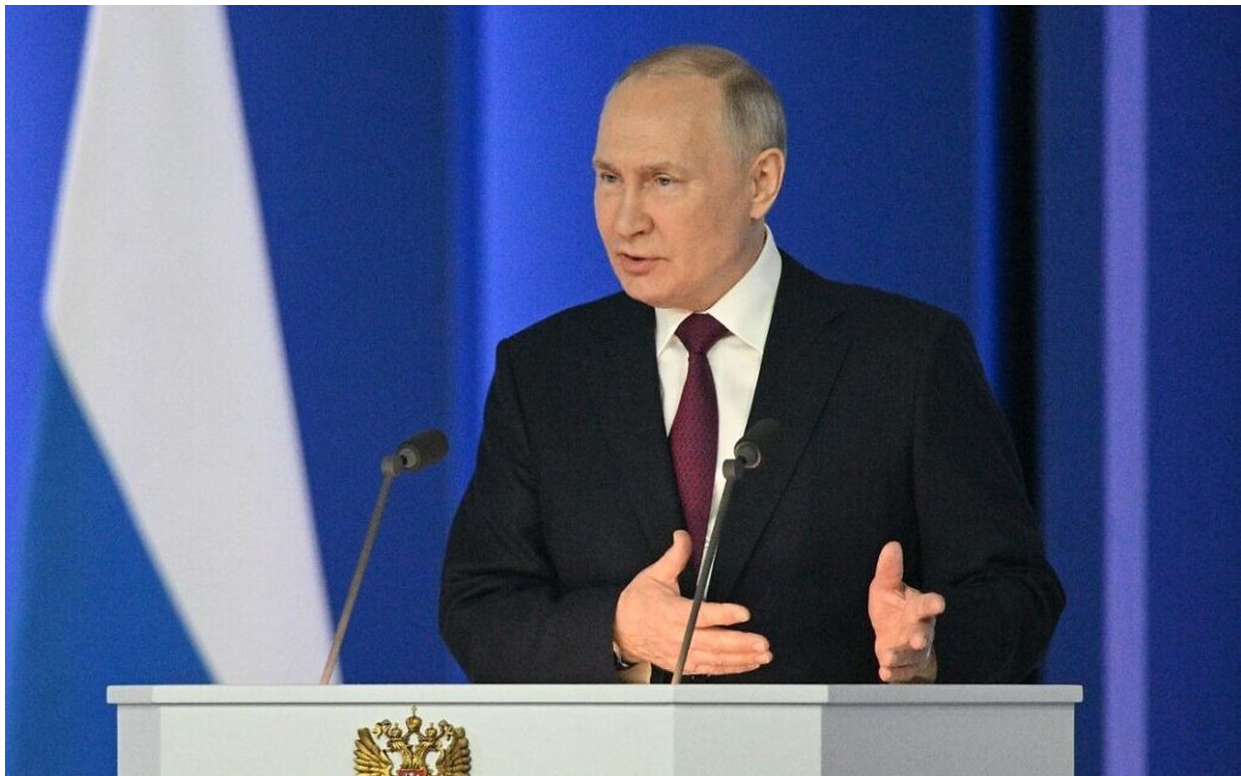
Vladimir Putin při projevu o stavu federace, 21. února 2023

Jak zaznělo v Putinově projevu, nic se vlastně nezměnilo, protože Evropa znovu chce dobýt Rusko a znovu používá Ukrajinu jako svůj nástroj. Jenže tehdy ve 30. letech minulého století to byla právě západní Evropa, která dala šanci, aby se zrodily dva politické systémy usilující o porážku Ruska, a to německý nacismus a italský fašismus. Byly to země západní Evropy, které světu přinesly vypuknutí II. světové války. A cílem této války bylo dobytí Ruska, stejně jako je tomu dnes.