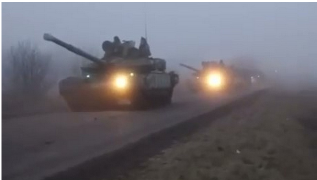
Tanky T-90M tankery Jižního vojenského okruhu.