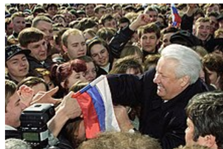
Boris Jelcin , první prezident Ruské federace , během volebního shromáždění v Bělgorodu, 1996

12. června 1990 přijal Výbor lidových zástupců republiky Deklaraci o suverenitě RSFSR. 17. března 1991 bylo realizováno referendum o zachování Sovětského svazu , jehož se účastnilo 80 % registrovaných voličů. Z nich se 76,4 % vyjádřily pro zachování Svazu. Byla zřízena funkce prezidenta RSFSR. 12. června 1991 byl prvním prezidentem Ruska zvolen Boris Jelcin , který získal 57 % odevzdaných hlasů (nastoupil do úřadu 10. července). 18. srpna 1991 skupina vysoce postavených funkcionářů uskutečnila pokus o obnovení sovětské vládní moci. Do dějin tento pokus vešel pod označením Srpnový puč a skupina iniciátorů jako Vládní výbor pro výjimečný stav. Jejich cílem bylo zrušení demokratických přeměn let 1990 - 1991. Rychlým potlačením puče zároveň selhal poslední pokus o odvrácení rozpadu SSSR. Již 8. prosince 1991 pak hlavy Ruska, Ukrajiny a Běloruska podepsaly Prohlášení o vytvoření Společenství nezávislých států (SNS) stanovící, že „SSSR jako subjekt mezinárodního práva přestal existovat“. 25. prosince 1991 byla RSFSR oficiálně přejmenována na Ruskou federaci a v 19 hodin 38 minut nad Kremlem zavlála (namísto vlajky SSSR) ruská trikolóra.