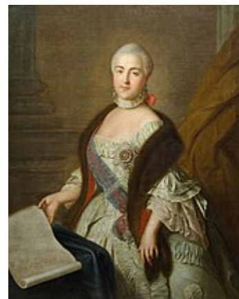
Ruská carevna Kateřina Veliká

vládou Turků . Dalšími významnými počiny Petra Velikého, které umožnily rozvoj Ruska, byly jeho sociální reformy, snaha o modernizaci země, zavádění manufaktur, rozvoj školství a vědy. Byla vytvořena silná armáda, vzniklo ruské loďstvo. Po smrti Petra Velikého sice nezaznamenalo Rusko žádné velké úspěchy, ač se účastnilo sedmé rakousko-turecké války , ale vše se změnilo nástupem Kateřiny II. Veliké . Tato žena Petra III. zavedla v Rusku tzv. osvícenský absolutismus .