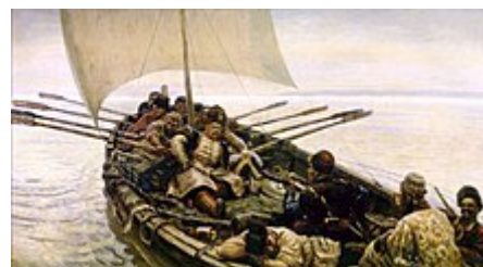
Stěnka Razin na Kaspickém moři

Po smrti Fjodora I. roku 1598 vymřela dynastie Rurikovců, čímž se Rusko dostalo do období rozporů a bojů o carskou korunu, nazývané také jako období smuty . Počátkem 17. století vládl Rusku Boris Fjodorovič Godunov , ovšem roku 1605 se objevil člověk, který se vydával za careviče Dimitrije, syna Ivana Hrozného, který byl již dříve zavražděn. Tento ve skutečnosti chudý šlechtic, který byl později nazván Lžidimitrij I. , byl za účasti Republiky obou národů dosazen na carský trůn. V Rusku poté vypukly rozbroje a roku 1610 obsadila polská vojska Moskvu. Po