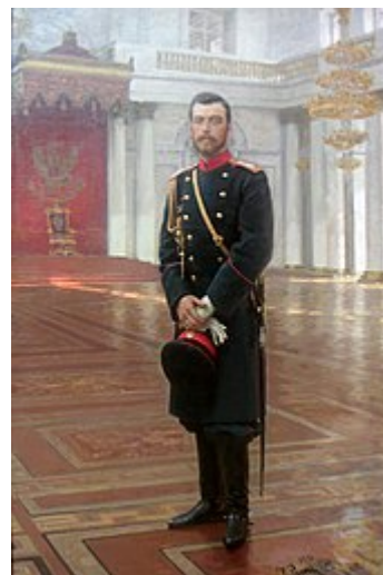
Mikuláš II. , poslední ruský car

Dne 13. března (28. února) 1917 byl sestaven dvanáctičlenný prozatímní výbor Státní dumy a vznikla Prozatímní vláda , do jejíhož čela se postavil kníže Georgij Lvov . Vojenskou moc však v Petrohradě držel ve svých rukou Petrohradský sovět pod kontrolou menševiků , složený z dělnických, rolnických a vojenských zástupců. Ti ovšem nebyli regulérně