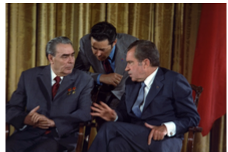
Leonid Brežněv při rozhovoru s prezidentem Nixonem při návštěvě USA