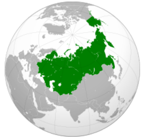
Ruské impérium v roce 1866

vojska v bitvě u Slavkova a Rusko zanedlouho z koalice opět vystoupilo. Po bitvě u Slavkova zůstala jediným soupeřem Francie v Evropě Anglie. Napoleon se proti ní rozhodl bojovat ekonomicky - blokadou. V roce 1812 obvinil Rusko z porušování této blokády, napadl je a zahájil tak své ruské tažení . Napoleon úspěšně pronikl na ruské území, ve velké bitvě na Berezíně si vybojoval cestu do Moskvy, tu však po jeho příchodu stihli Rusové zapálit. V následující bitvě u Borodina utrpěl Napoleon Bonaparte rozhodující porážku a byl z ruského území vytlačen. Ruská armáda tak nakonec odrazila útok 422-tisícového napoleonského vojska. Západní oblasti Ruského impéria v ní utrpěly značné škody. Ruská vojska pronásledovala prchajícího Napoleona, v lednu 1813 překročila řeku Němen , vpadla do Pruska a začala osvobozovat Německo od francouzských okupačních vojsk. Dne 4. března 1813 dobyli Rusové Berlín a 27. března obsadili Drážďany . Za pomoci pruských partyzánů osvobodili i Hamburg . Ve dnech 16.-19. října 1813 se odehrála bitva, která do světových dějin vešla pod názvem Bitva národů nebo bitva u Lipska . V ruských dějinách je toto období známé pod názvem Evropský osvobozenecký pochod ruské armády . Francouzská vojska Napoleona I. byla spojenými rusko-prusko-rakouskými vojsky poražena, a tak dne 31. března 1814, mohla ruská vojska vstoupit do Paříže .