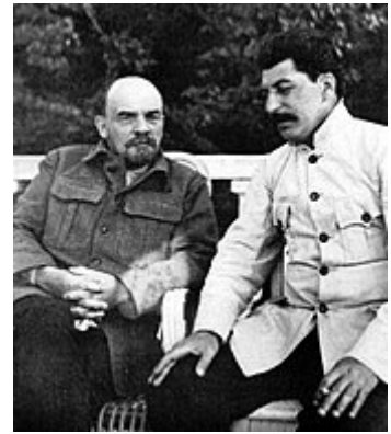
Lenin a Stalin v Gorki (1922)

22. června 1941 nacistické Německo bez vyhlášení války napadlo SSSR . Začala Velká vlastenecká válka . Za několik málo měsíců německá armáda obsadila západní část země: Pobaltí, Bělorusko, většinu Ukrajiny a západní část RSFSR (i když pokus ovládnout Moskvu ztroskotal). Okupanti vystavili represím nejen představitele sovětské moci, ale všechny obyvatele obsazených území. Začalo partyzánské hnutí. Ve stejnou dobu, do konce roku 1942, se završilo