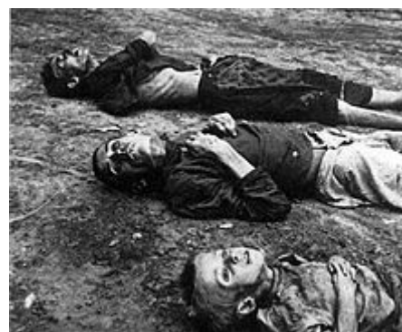
Hladomor v Povolží zabil odhadem 5-6 milionů lidí.