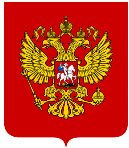
Státní znak Ruské federace