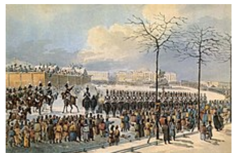
Děkabristé na Senátním náměstí