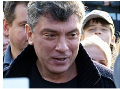
Boris Němcov byl zavražděn 27. února 2015 na mostě poblíž Kremlu

právně zakotvila. Ruská federace se stala právní nástupkyní SSSR, převzala po něm místo stálého člena Rady bezpečnosti OSN a dosavadní mezinárodní smlouvy SSSR. Hlavním důvodem pro souhlas ostatních svazových republik s tímto postupem byl závazek RF převzít všechny dluhy SSSR (ačkoli obyvatelstvo Ruska tvořilo méně než polovinu všech obyvatel SSSR). Status Ruska jako obnovené federace byl formálně zakotven Federální smlouvou, uzavřenou 31. března 1992 téměř všemi subjekty federace. Nesouhlas Tatarstánu a zejména Čečenska byl prvním výrazem separatistických tendencí, které nový stát existenčně ohrožují a vedou k mnoha krvavým válkám. 2. dubna 1997 naopak Rusko a Bělorusko vytvářejí vzájemný svazek, který se postupně přeměnil z konfederativního vztahu na měkkou federaci podle vzoru SSSR. Pokud jde o ekonomiku, 2. ledna 1992 začala liberalizací cen radikální ekonomická reforma. Už v prvních měsících roku se trh začal naplňovat spotřebními předměty, ale v důsledku hyperinflace se životní úroveň obyvatel prudce propadla. Ve stejné době došlo v důsledku rozpadu SSSR k přerušení mnoha výrobních vazeb, což mělo negativní dopad na ekonomiku RF. Na území jiných států se ocitla většina existujících nezamrzajících přístavů, ale i námořní obchodní flotily, podstatné části bývalých svazových ropovodů a plynovodů a mnoho nejmodernějších podniků.