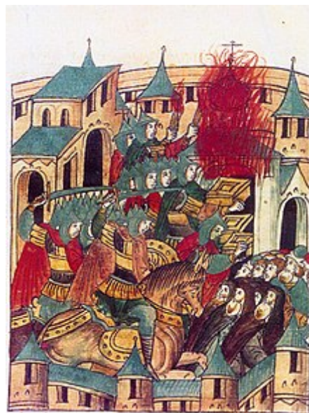
Plnění Suzdalu Bátúem v únoru 1238

Moskevské knížectví vzniklo jako podíl na dědictví vladimirského Alexandra Něvského († 1263), když si Moskvu zvolil sídlo jeho nejmladší syn Daniil . Nové knížectví rychle získávalo moc a Moskva se stala sídlem hlavy pravoslavné ruské církve , když vladimirský „ metropolita Kyjeva a vši Rusi“ Petr Moskevský v roce 1325 přesídlil do Moskvy. Země však byla pod přímým vlivem Zlaté hordy , která vznikla jako důsledek tatarsko-mongolských výbojů. Ruská knížectví musela platit jejím vládcům daň a byla na nich i politicky závislá. Roku 1328