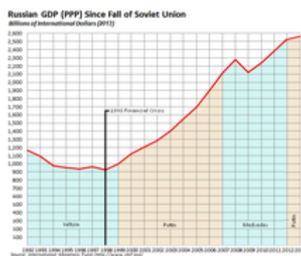
Vývoj ekonomiky Ruska od rozpadu SSSR