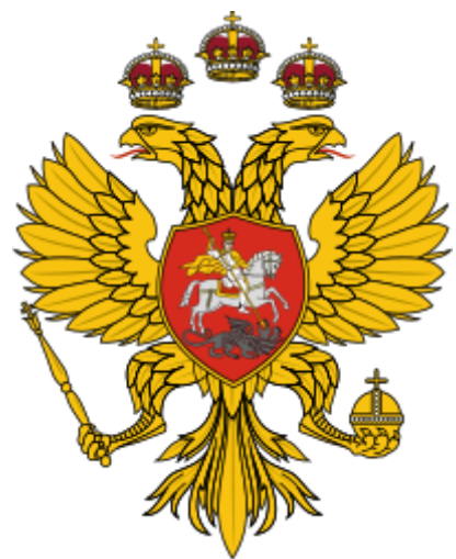
Znak Ruského carství