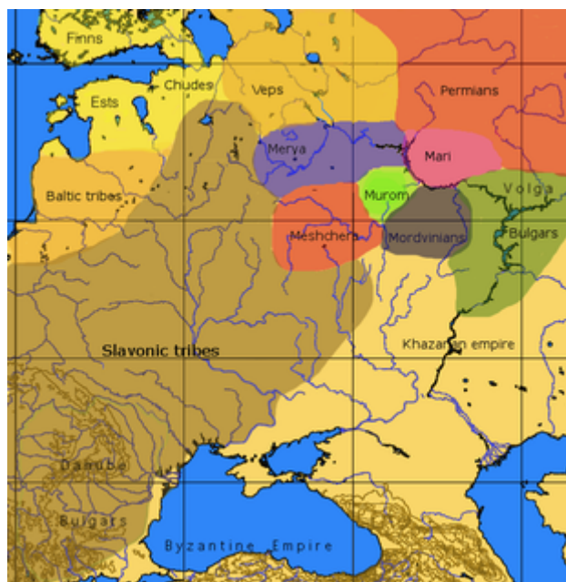
Mapa evropského Ruska v době příchodu Varjagů

zahájily ničivou expanzi proti Číně a na západě přes Kyjevskou Rus do střední Evropy . V roce 1223 bylo ruské vojsko poraženo Mongoly v bitvě na řece Kalce . O 17 let později se Kyjevská Rus rozdělila na čtyři knížectví, když Čingischánův vnuk Batú dobyl Kyjev . V roce 1240 porazil na břehu řeky Něvy kníže Alexandr Jaroslavič (později zvaný Něvský ) švédská vojska při jejich invazi do Rusi. V roce 1242 porazil v bitvě na Čudském jezeře Řád německých rytířů .