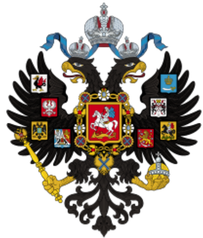
Státní znak Ruského impéria

Koncem 13. století době došlo k rozvoji Moskevského knížectví , jež postupně získávalo stále větší území a poté i nezávislost na mongolské Zlaté hordě . V 16. století se moskevští vládcové začali titulovat jako carové (císaři) v návaznosti na zaniklou Byzantskou říši. Za vlády Ivana IV. zvaného Hrozný došlo k razantní územní expanzi na sever a na východ, kde byl dobyt Kazaňský chanát . Do této doby také spadá státem organizovaný teror zvaný opričnina . Po smrti Ivana IV. a jeho pozdějšího nástupce Borise Godunova se Rusko dostává do krize, jež byla ukončena nástupem dynastie Romanovců . Jeden z nejvýznamnějších carů Petr I. Veliký dosáhl dalších územních zisků a provedl také rozsáhlé hospodářské a vojenské reformy. Další významnou panovnicí byla carevna Kateřina II. Veliká , za jejíž vlády došlo k dalšímu rozmachu ruské moci, a to zejména na úkor Polska, které roku 1795 úplně zaniklo a bylo rozděleno mezi Rusko, Prusko a Habsburskou monarchii . Po Velké francouzské revoluci a jako významná vojenská mocnost v době napoleonských válek prosazovalo Rusko svůj vliv v řadě zemí Evropy s cílem zamezit jakýmkoliv revolučním změnám. Po prohrané krymské válce mezi Ruskem na jedné straně a Velkou Británií, Francií, Sardinským královstvím a Osmanskou říší na straně druhé se rozhodl car Alexandr II. přistoupit na několik opatření, která měla