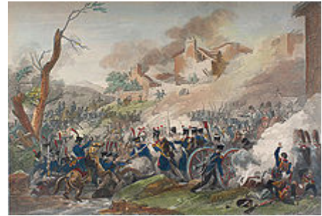
Bitva u Lipska

V roce 1806 ruská vojska napadla dunajská knížectví s cílem překazit Osmanské říši snahy o krutá zvěrstva prováděná na obyvatelstvu v Srbsku , začala tak další rusko-turecká válka. Na Kavkaze se ruské armádě podařilo potlačit nájezd tureckých vojsk na Gruzii. Tímto krokem získali města Anapa a Poti a za Dunajem Oršavu , Ruse , Giurgiu , Turno a Pleven . V roce 1811 maršál Michail Illarionovič Kutuzov zastavil postup