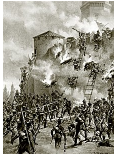
Bitva o Gandžu během rusko-perské války v letech 1804-1813