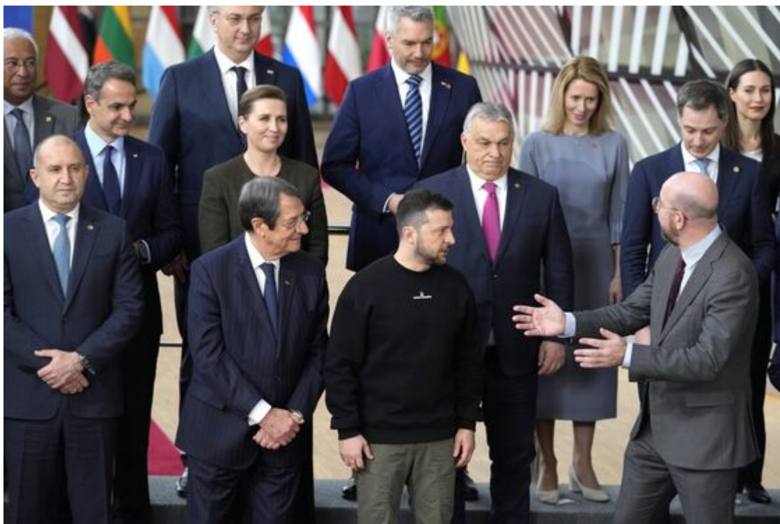
Ukrajinskému prezidentovi Volodymyru Zelenskému tleská předseda Evropské rady Charles Michel, když se vedoucí představitelé EU scházejí na rodinné fotografii před summitem v Bruselu, 9. února 2023.

sama zvýšila kvůli prudkému nárůstu ceny ropy a poté byla nucena ji snížit, aby nedopustila doprovodné zdražení všech hlavních kategorií zboží a nevyvolala další vlnu negativních reakcí vlastních občanů. Tiskařský lis celoevropské měny se roztočil na plné obrátky, mimo jiné proto, aby nějak zpomalil růst maloobchodních cen elektřiny.