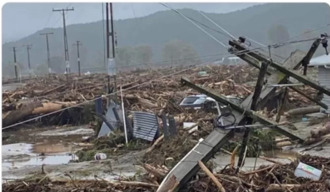
Napier February 2023