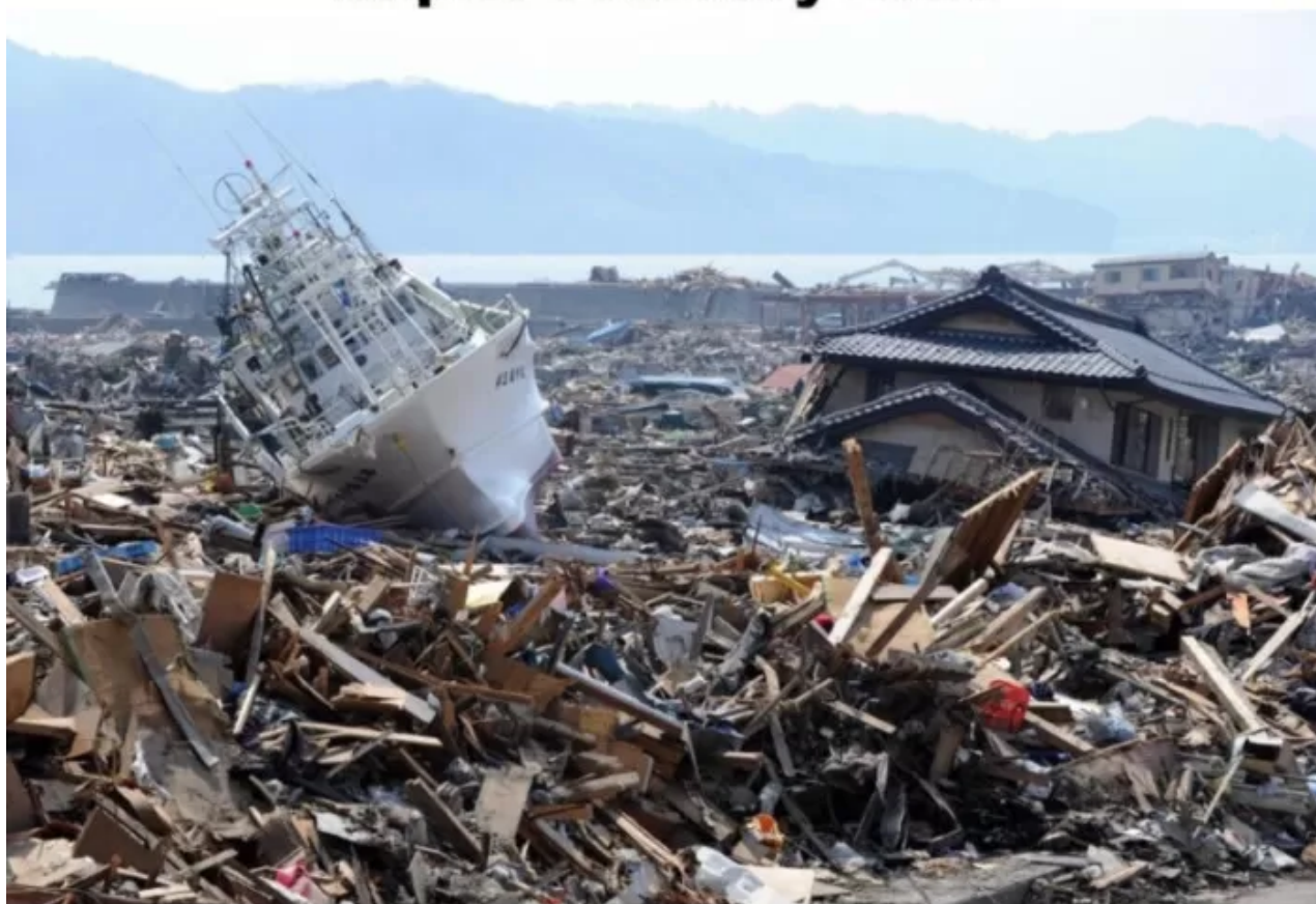
Japan Tsunami March 2011