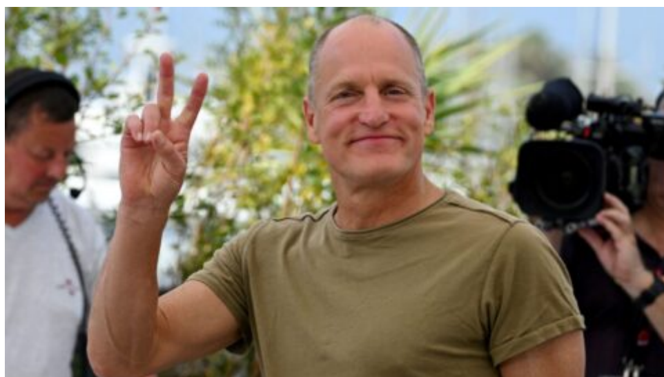
Hollywoodští herci vystupují proti povinnému anticovidovému očkování