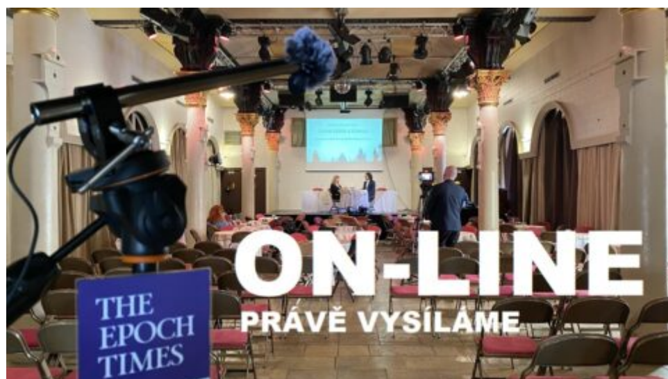
Přímý přenos z odborné konference Česká cesta z covidu