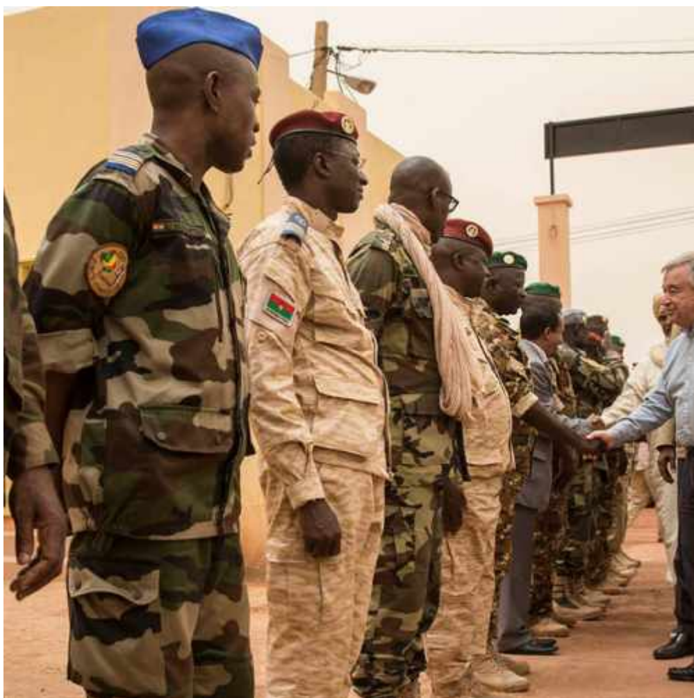
Čeští vojáci se zapojí do boje proti terorismu v Africe