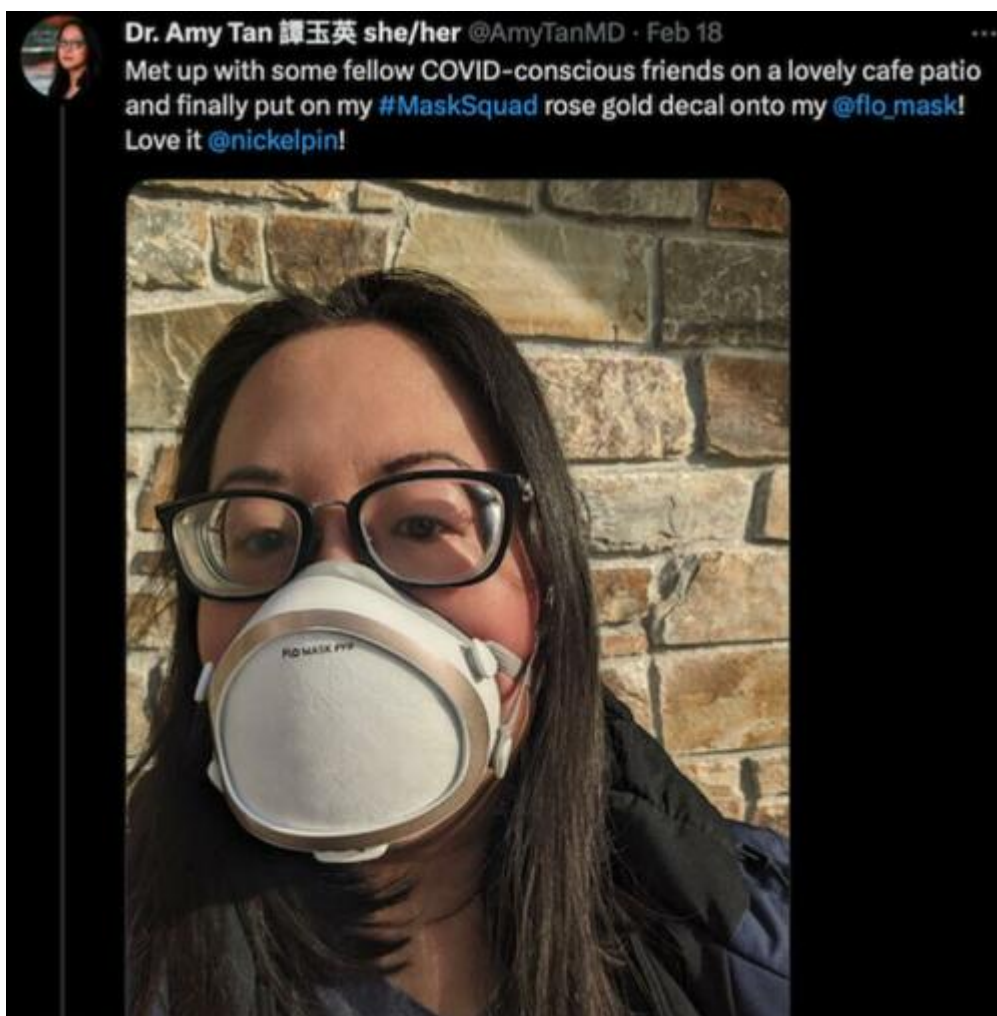
Screenshot tweetu doktorky Amy Tan zveřejněného 18. února 2023.

Její komentáře vyvolávají dlouhodobé obavy, že se masky staly prostředkem pro sociální a politické, nikoli lékařské agendy.