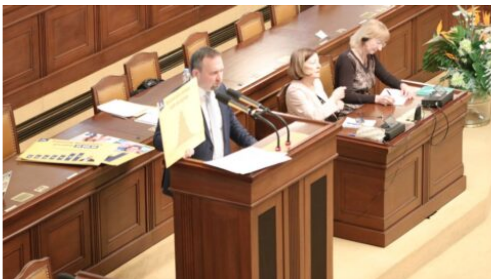
Poslanci schválili novelu o navýšení důchodu o 760 Kč