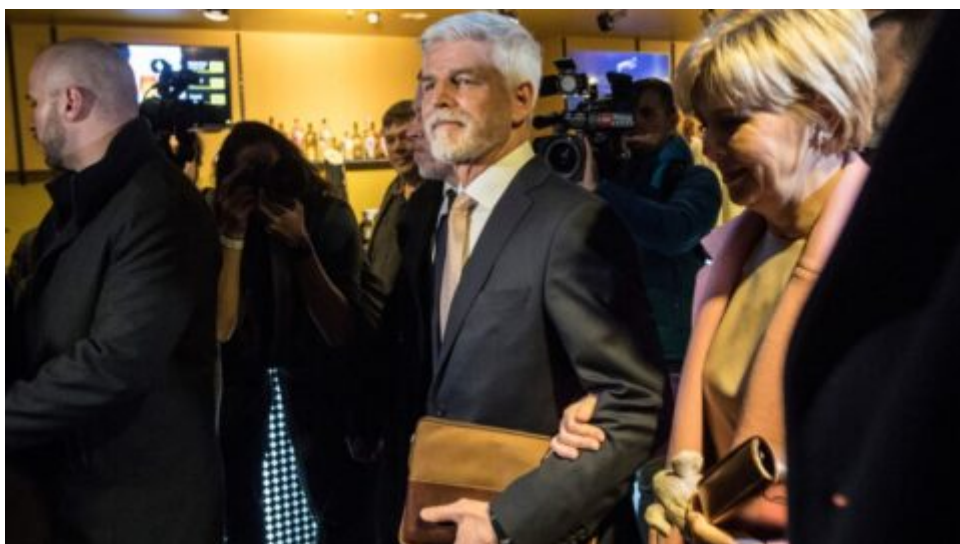
Hrad: Kdo posílí Pavlův prezidentský tým