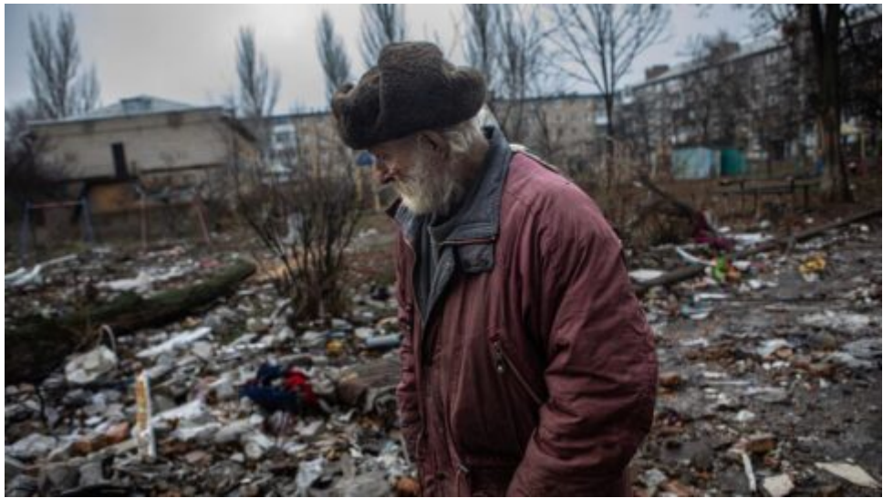
Bachmut – poslední zprávy z bojů podává česká válečná zpravodajka