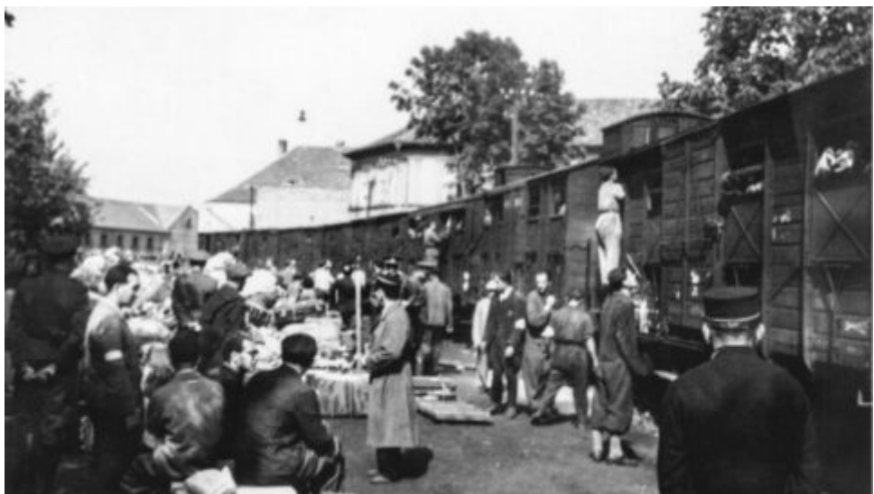
Památník ticha připomene největší jednorázovou masovou vraždu československých obyvatel