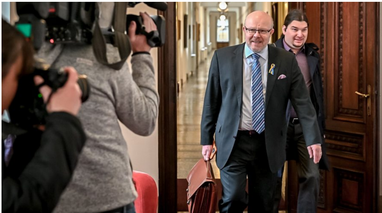
Vicepremiér a ministr zdravotnictví Vlastimil Válek, 17. března 2022.