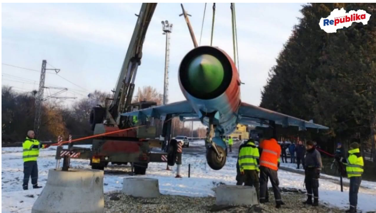
Svědék natočil odstraňování památníků v parku na Sliači (MiG-21)

Stíhačka sloužila jako památník a místně schválená dekorativní stavba parku. Měla na sobě slovenské výsostné znaky. Proč musela stíhačka pryč, to nikdo netuší, ale na slovenských sociálních sítích už běží sarkastické a ironické memy, že Jaroslav Naď tu stíhačku potřebuje pro vzdušnou obranu Slovenska, alespoň tu jednu stíhačku z parku, protože všechny ostatní modernější stíhačky MiG-29 rozdal Ukrajincům.