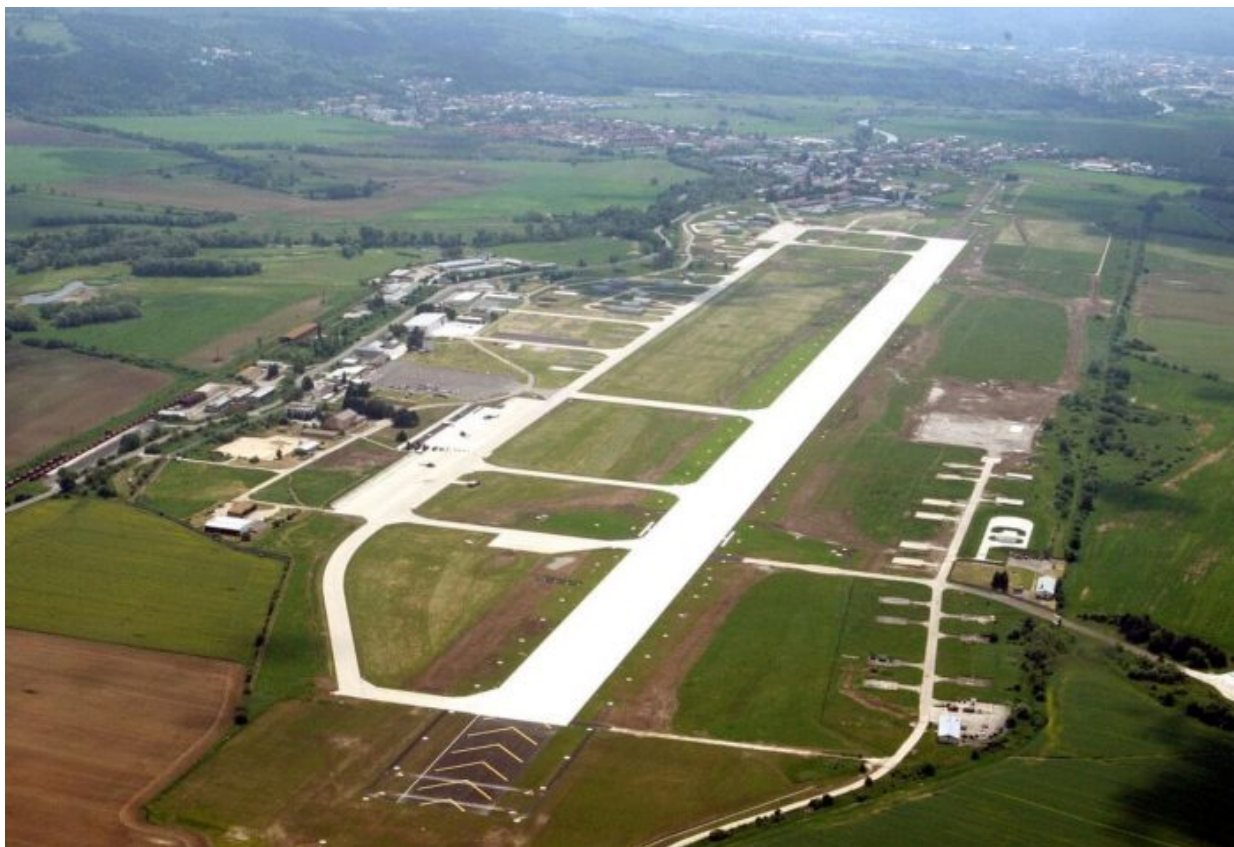
Páteřní letiště Varšavské smlouvy, kóta Sliach

Pokud by došlo k eskalaci války na Ukrajině do otevřeného konfliktu mezi Ruskou armádou a NATO, což prakticky v této chvíli už nejde vyloučit, když evropští politici prohlašují, že nepřijmou nic jiného než porážku Ruska, potom by americká armáda musela z Belgie, z Holandska, z Německa a Itálie přesunout jaderné hlavice blíže k Ukrajině a někde by ty hlavice musely být rozmístěny na nosiče.