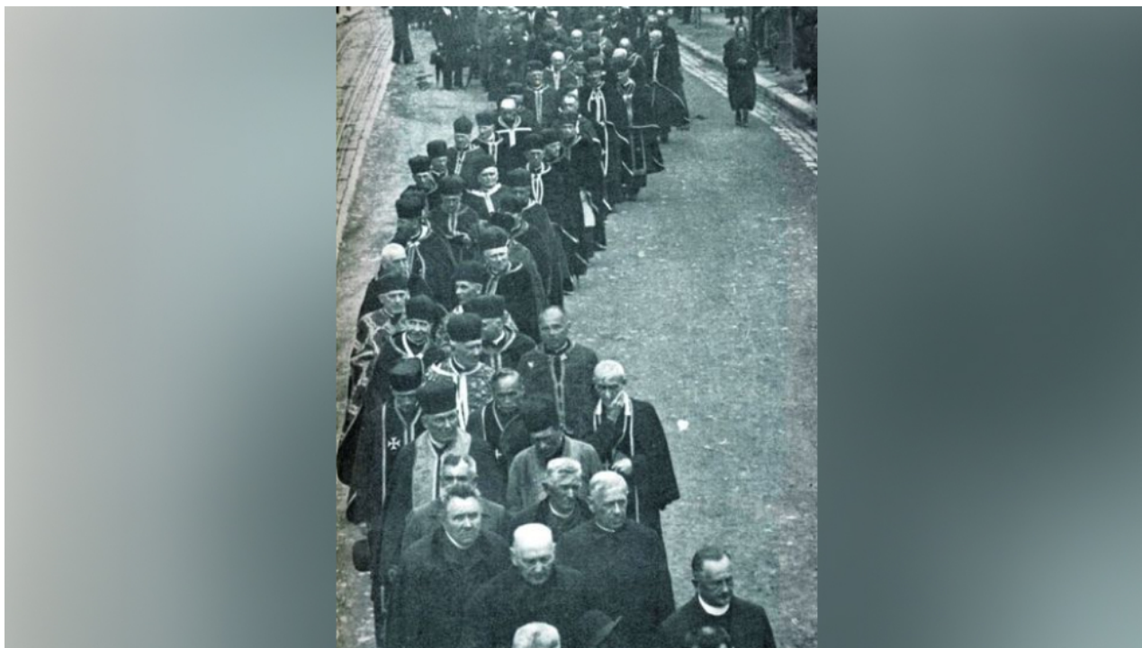
SOUBOR FOTOGRAFIE. Průvod účastníků kongresu Talerhof u příležitosti otevření pomníku obětem Talerhofu, 1934.

V období mezi dvěma světovými válkami se bývalí vězni snažili uchovat památku na tragédii, která postihla haličské Rusíny, a zvěčnit památku obětí Thalerhofu. První pomník byl postaven v roce 1934 a brzy se podobné pomníky objevily i v dalších částech regionu. V letech 1924-1932 vycházel almanach Thalerhof. Poskytl listinné důkazy a svědectví očitých svědků o genocidě. V letech 1928 a 1934 se ve Lvově konaly kongresy Thalerhof, kterých se zúčastnilo přes 15 tisíc účastníků.