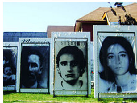
Zmizelí lidé v umění v Parque por la Paz ve Villa Grimaldi v Santiagu de Chile