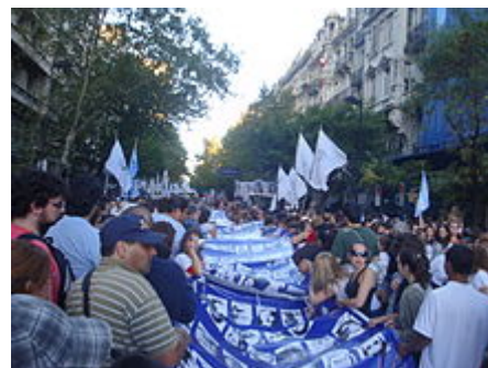
Vlajka s obrázky těch, kteří zmizeli během demonstrace v Buenos Aires k 35. výročí převratu v Argentině v roce 1976 .