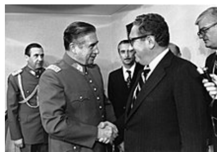
Chilský diktátor Augusto Pinochet si v roce 1976 potřásl rukou s Henrym Kissingerem

Henry Kissinger , ministr zahraničí Nixonovy a Fordovy administrativy, byl dobře obeznámen s plánem Condor a byl úzce diplomaticky zapojen s vládami Jižního kužele, a to tak daleko, že byl osobním hostem Jorgeho Videly na mistrovství světa 1978 v Argentině . skončilo jeho působení ve funkci státního tajemníka. [148] Podle francouzského listu L'Humanité byly podepsány první dohody o spolupráci mezi CIA a proticastrovskými skupinami a pravicovou eskadrou smrti Triple A , kterou v Argentině zřídili Juan a Isabel Perónovi „osobní tajemník" Jose Lopez Rega a Rodolfo Almiron (zatčen ve Španělsku v roce 2006). [149]