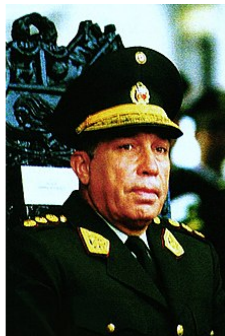
Peruánský diktátor Francisco Morales Bermúdez byl součástí operace Condor.