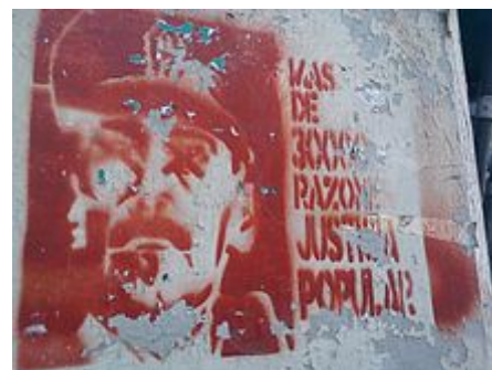
Graffiti v Buenos Aires , požadující spravedlnost pro oběti občansko-vojenské diktatury Argentiny

skupina matek, jejichž děti zmizely, každý čtvrtek demonstrovat před