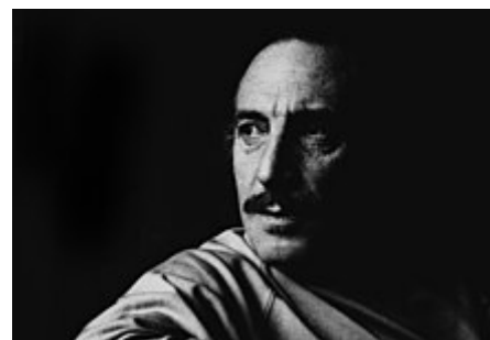
Letelier v roce 1976

V prosinci 2004 Francisco Letelier, syn Orlanda Leteliera, napsal ve sloupku OpEd v Los Angeles Times , že atentát jeho otce byl součástí operace Condor, kterou popsal jako „síť pro sdílení zpravodajských informací využívanou šesti jihoamerickými diktátory té éry k odstranění disidentů.“ [92]