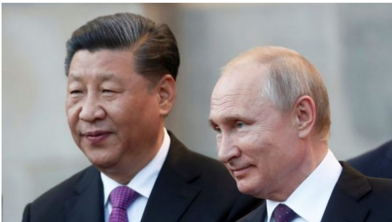
Si Ťin-pching a Vladimir Putin

Evropa se postupně začne ekonomicky hroutit spolu s tím, jak začne pociťovat důsledky odříznutí od levných ruských surovin. Rusko a Čína nebudou brát ohledy na Green Deal a ani na emise, jejich ekonomiky poletí nahoru a západní svět se postupně promění do zemí 3. světa s rozvojovým charakterem, který poznáte podle zchudlého obyvatelstva, které nemá ani na zaplacení základních a donedávna nezbytných životních potřeb, jako je elektřina, plyn nebo jídlo v podobě zeleniny či masa. Inflace tak likviduje lidem na západě celoživotní úspory.