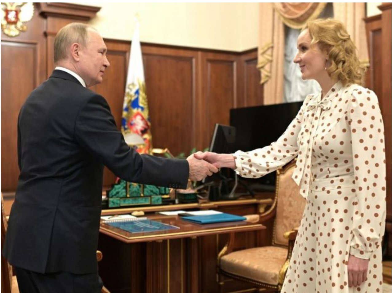
Vladimir Putin a Maria Bělova

Návštěva čínského prezidenta Si Ťin-pchinga v Moskvě před několika dny nedává spát západním médiím a politikům, kteří v této návštěvě vidí ohrožení současného světového řádu. Čínský prezident totiž přijel na státní návštěvu Ruska v době, kdy se kolektivní Západ intenzivně snaží Rusko maximálně izolovat dosud bezprecedentním krokem, a to zatykačem Mezinárodního trestního soudu (ICC) na prezidenta jaderné velmoci a země, která je trvalým členem Rady bezpečnosti OSN, na Vladimira Putina a ruskou ombudsmanku na ochranu práv dětí, Marii Lvovovou-Bělovou. Zatykače byly vydány na základě žalob za údajný únos dětí z DLR a LLR do Ruské federace, což je samo o sobě absurdní, vzhledem k důvodům, které k odjezdu dětí vedly.