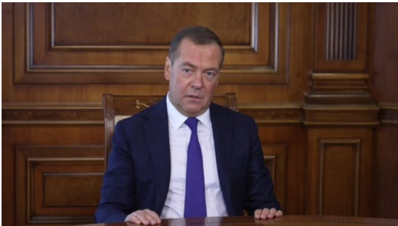
Dmitrij Medveděv, ex-prezident a náměstek šéfa Bezpečnostní rady Ruské federace

To bylo naprosto nečekané. Kolektivní západ si proto teď není jistý, jak daleko lze zajít na Ukrajině s protiruskou agresí a s vyzbrojováním, než Rusko nějak zareaguje rovněž vojensky a s použitím jaderných zbraní. A jak se ukazuje, nápad s nasunutím uranové munice z Londýna je prostě další z eskalačních pokusů Západu o zjištění, kdy lze Rusko zatáhnout do jaderného režimu války. Pamatujte, jak šel čas. Nejprve západ prohlašoval, že poskytne Ukrajině jenom obranné a lehké zbraně, protože nasunutí těžké techniky by mohlo eskalovat situaci a zatáhnout NATO do konfliktu s Ruskem.