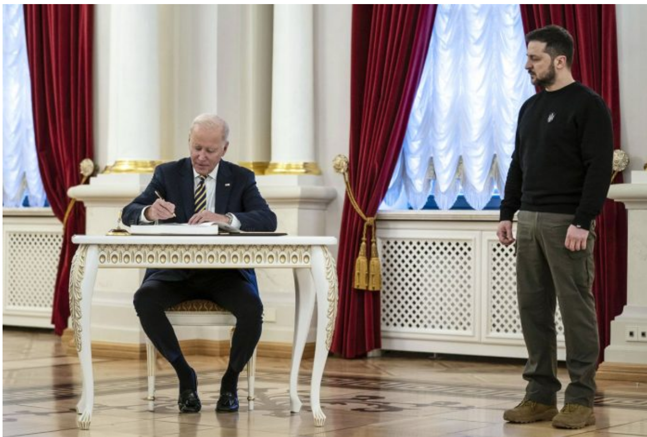
Zelenský drží čestnou stráž při návštěvě Joea Bidena v Kyjevě

Takže i stíhačky budou. A co jaderné zbraně? Ty určitě ne, to by zatáhlo NATO do války s Ruskem... říkají politici dnes. Ale... co za pár měsíců? Doufám, že chápete, kam to vede. Celé je to divadlo s panem Overtonem a jeho posuvným oknem. Co je dnes nemyslitelné, je zítra možné, pozítří nutné a po pozítří realita. De facto se tím otupuje odpor západní veřejnosti, kdyby to kolektivisté Ukrajině všechno poslali naráz a najednou, to by vyvolalo odpor a pozdvižení v zemích EU.