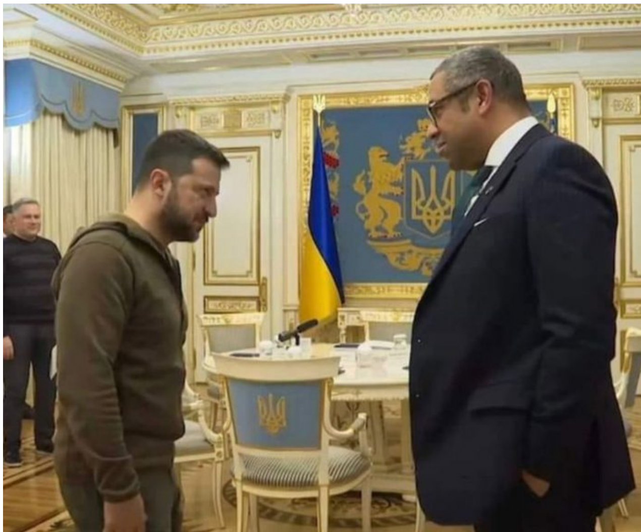
Americký ministr obrany Lloyd Austin během návštěvy Kyjeva. Póza Zelenského vypovídá za vše...

Západ tak neví, kde je hranice ruského válečného zapojení v důsledku západních kroků proti Rusku. Není jasné, kde je ta hranice, kdy Rusko usoudí, že je čas použít jaderné zbraně. Pokud začnou Ukrajinci sypat uranovou municí na ruská města na Donbasu, nebude to dlouho trvat a Moskva znovu šokuje západ, stejně jako 24. února minulého roku. Pokud Moskva usoudí, že nelze Ukrajince zastavit v sypání uranové munice na ruská města, dojde k rozkazu umlčet chocholaté Ukrajince taktickým úderem. Cílem už nebude vyhnat prasata z žita, ale zabránit ostatním prasatům, aby do toho žita lezla. To je příměr, který už dvakrát zazněl na adresu Ukrajinců u Vladimira Solovjova v jeho pořadu a varování Medveděva západu, aby nepodceňoval ruské odhodlání bránit se, se proto nesmí brát na lehkou váhu.